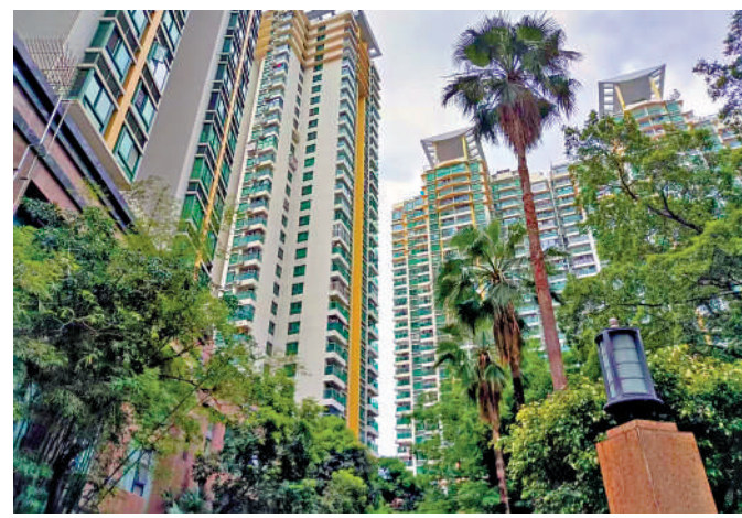
▲皇御苑分六期建設，以塔樓為主，綠化率達40%。

對於經常往返深港兩地的居民而言，新皇崗口岸帶來的最直觀利好，是時間成本的大幅下降。新口岸採用了最先進的「合作查驗、一次放行」模式，取代了過去繁瑣的「兩地兩檢」。旅客只需排一次隊、刷一次證件，5分鐘即可完成通關，相較於過去高峰期動輒半小時以上的等待，效率提升了6倍。作為深港唯一的24小時通關陸路口岸，它打破了「夜歸人」的時空限制，無論是深夜商務急件，還是凌晨的跨境消費，深港雙城從此真正實現了無縫接駁。