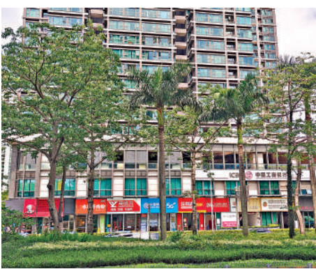
▲金領假日公寓自帶底層商舖，住戶購物便利。