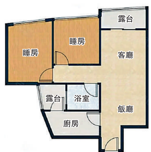
▲廊橋國際75平米兩房兩廳戶型圖。

商業與生活配套完善，屋苑獨立配備約1.4萬平米三層商業裙樓，大型品牌超市、中西酒樓、高檔生活配套一應俱全。教育方面，社區自帶皇御苑幼兒園及皇御苑學校，周邊還有福南小學、福田中學等多所學校。