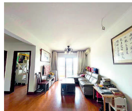
▲廊橋國際單位空間布局合理，採光通風俱佳。