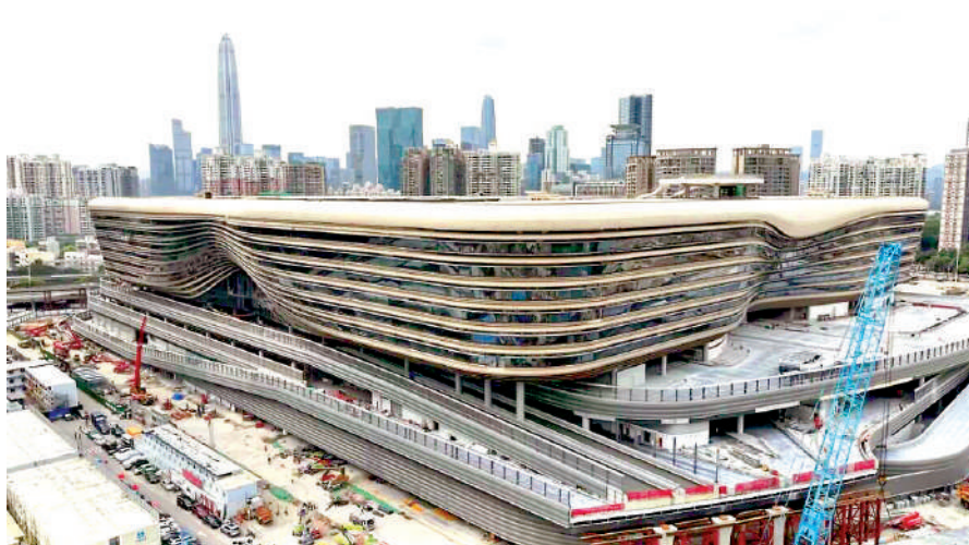
▲新皇崗口岸即將開通，為深港居民和旅客帶來便利。