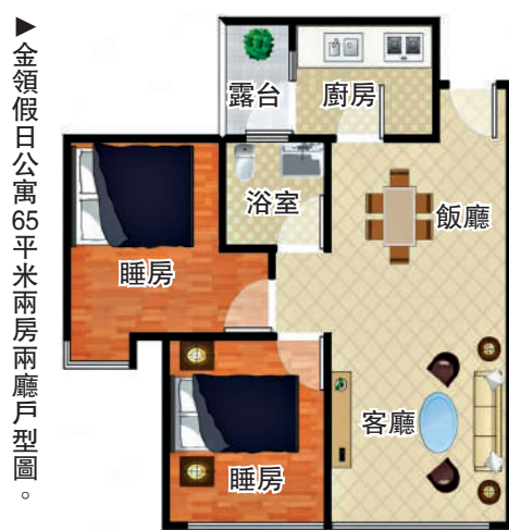
▲金領假日公寓65平米兩房兩廳戶型圖。

商業與生活配套成熟完善，屋苑自帶約6000平米商業裙樓、底層商舖及皇御苑超市，附近沃爾瑪可滿足日常所需；2公里內可達COCO Park購物公園、卓越INTOWN購物中心等大型商場。