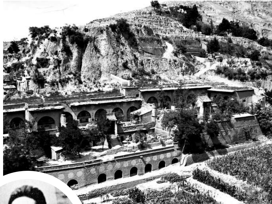
▲「四大隊」跟隨黨中央轉戰陝北時在米脂縣楊家溝的駐地。