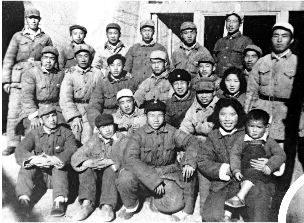
▲79年前，黨中央轉戰陝北期間，代號為「四大隊」的新華社工作隊始終緊隨。圖為新華社新聞台部分人員合影。

79年前，黨中央轉戰陝北期間，代號為「四大隊」的新華社工作隊始終緊隨黨中央和毛主席。這支由范長江率領的隊伍，在歷時1年有餘，轉戰2000多華里，途經12個縣的轉戰陝北征途中，用紅色電波將黨中央的聲音傳遍全國，以每天抄收的新聞外電讓黨中央了解外界情況、輔助決策，為推進中國革命的勝利進程作出了卓越貢獻。