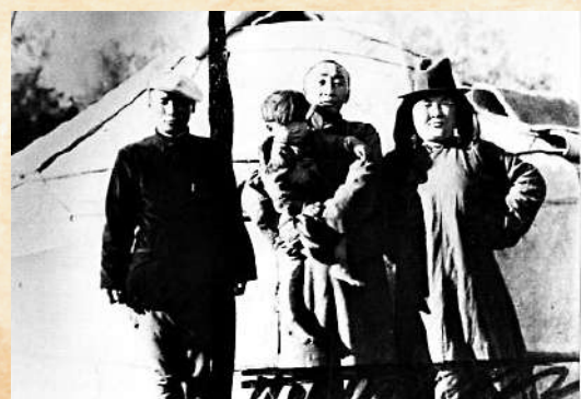
▲范長江（左一）在西北考察時留影。

胸懷國家前途，踐行文章報國。1935年，26歲的《大公報》記者范長江在熱情與迷茫交雜之中探索抗日救國之路。他敏銳地意識到在即將到來的抗日戰爭中，中國的西北將成為戰時的大後方。同時，他接觸到了活躍在陝北