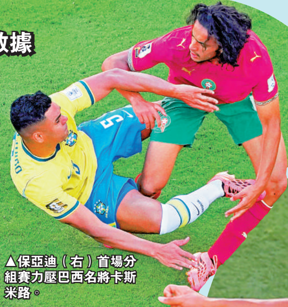
▲保亞迪（右）首場分組賽力壓巴西名將卡斯米路。