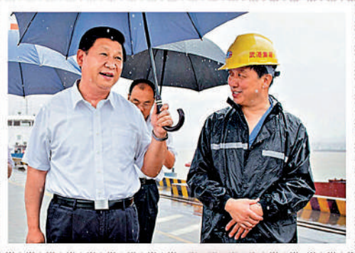
▲2013年7月21日，習近平總書記冒雨在湖北武漢新港陽邏集裝箱港區調研。