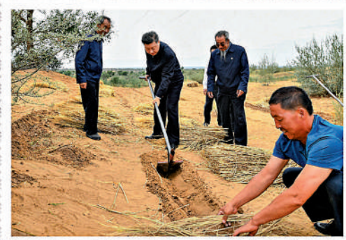
▲2019年8月21日，習近平總書記在甘肅八步沙林場參與治沙勞動。