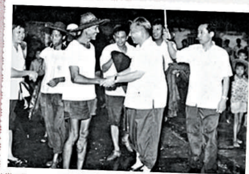
▲1980年9月，習仲勳在廣東湛江視察時與群眾親切交談。