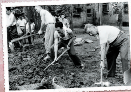
▲1980年春，習仲勳（右一）在廣州參加義務勞動。