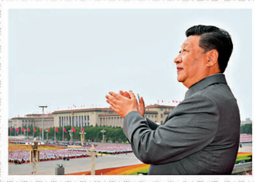
▲2021年7月1日，在慶祝中國共產黨成立100周年大會上，習近平總書記莊嚴宣示：「江山就是人民，人民就是江山。」