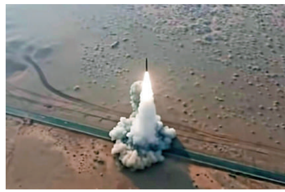
▲▼央視新聞《軍情時間到》20日披露東風-17實戰演練細節，外界首次看到東風-17發射狀態。圖為演練畫面。 視頻截圖