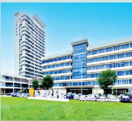
▲東鵬飲料除專注主打品牌外，還推出多款特色產品，以吸引更多飲用群體。

高韌性企業利用精一戰略確定企業的「本」，即使在危機到來之時，亦不忘記其使命及立身之本。高韌性企業保持着成長速度的敬畏和自律，並將其視為一項紀律而嚴格遵守。在成長速度