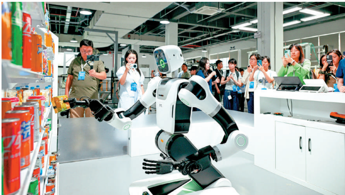
中國具備獨特的比較優勢，有助培育高成長型和高度複雜的新興及未來產業。