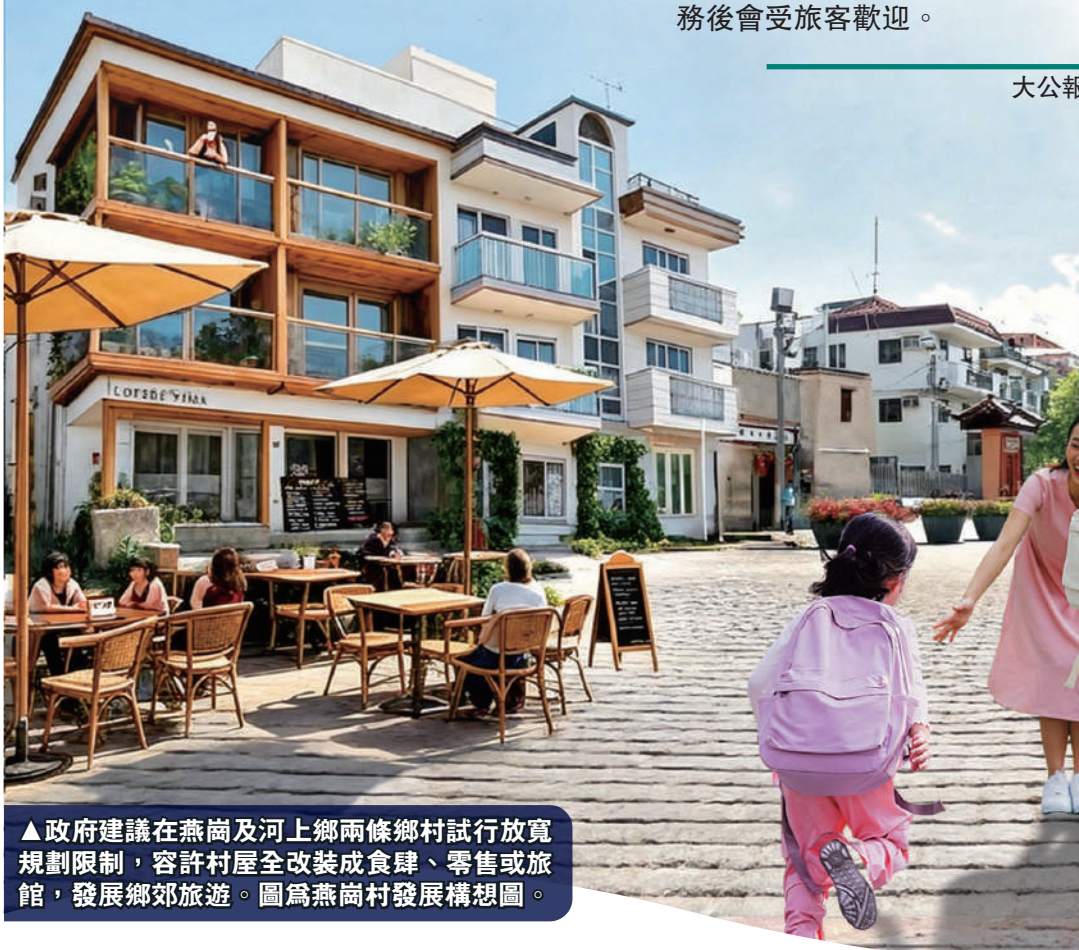
▲政府建議在燕崗及河上鄉兩條鄉村試行放寬規劃限制，容許村屋全改裝成食肆、零售或旅館，發展鄉郊旅遊。圖為燕崗村發展構想圖。

特區政府銳意將北都建設成「宜業、宜居、宜遊」社區，「城鄉共融」是發展重點之一，在打造都會區同時，帶動提升鄉村的生活質素和改善環境。發展局建議在燕崗和河上鄉兩條鄉村試行放寬「鄉村式發展」的規劃限制，容許村內現有新建豁免管制屋宇全棟或部分樓層作食肆、零售商店和旅館為經常准許用途。當局認為這兩條村鄰近古洞北新發展區，以及塋原自然生態公園等自然景點，是鄉郊旅遊理想試點。規劃署將於今年第三季開展相關規畫工作。