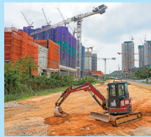
▲北都項目採用多元化的開發模式，香港金融業可在多個層面參與並支持北都建設。

解決方法： 政府應允許公營機構在風險可控下，豁免部分傳統招標限制，小額採購本土初創產品。有政府這個「第一客戶」的背書，更能撬動後續的私人融資