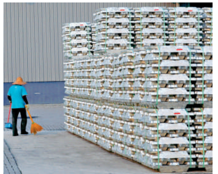
▲商品市場涉及一整套複雜的產業鏈，單靠市場自發力量，很難突破困局。

以大宗商品交易生態圈為例。這是香港仍處於起步階段的新賽道，政府便需展現積極作為。水志偉解釋，商品市場的成形，高度