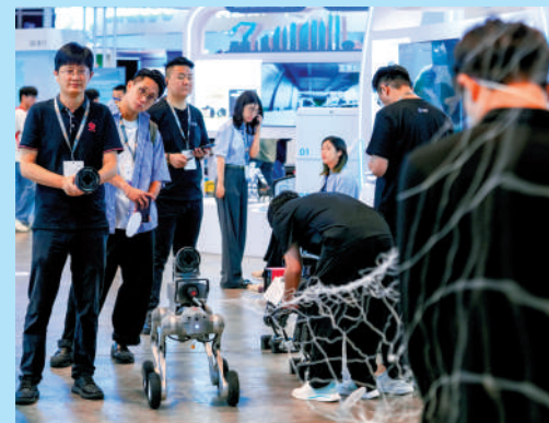
▲專家建議，可積極發展人工智能、生物科技等新興產業，培育全新經濟增長點。

相反，以已有優勢的資產及財富管理領域為例，政府便不應干預資產配置、產品設計或投資者的自主選擇。水志偉表示，政府的精力，應集中於優化市場營商環境與便利度，讓市場主導，政府搭台，方能各司其職，發揮最大效益。