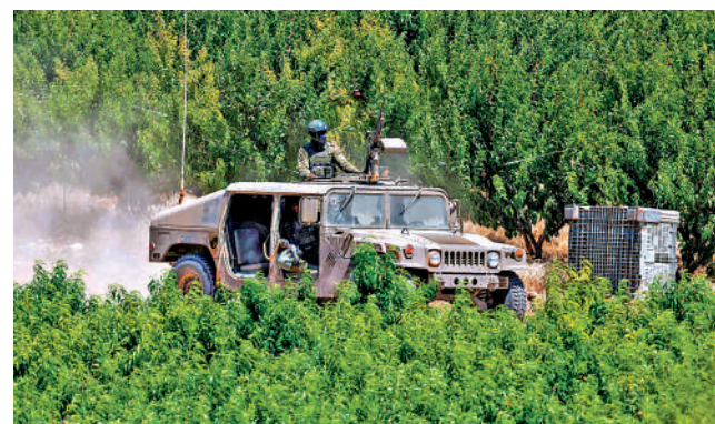
▲ 以色列政府拒絕從黎南部撤軍。圖為在黎以邊境巡邏的以色列軍車。

內塔尼亞胡21日稱，在以色列，有人會說他對美國總統特朗普有求必應，但他所維護的是「以色列的利益」。內塔尼亞胡揚言，只要有必要，以軍將一直留在黎巴嫩和加沙地帶的所謂「安全區」。以色列國家安全部長本-格維爾當天接受採訪時稱，整個黎巴嫩都應該成為以色列的「遊樂場」和打擊目標。對於美伊談判，他聲稱，伊朗人應該被「轟炸、轟炸、再轟炸」，美國不應簽署任何協議。