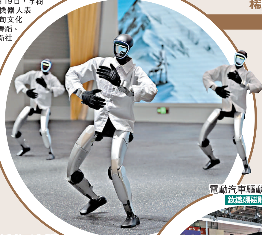
▲6月19日，字樹人形機器人表演緬甸文化主題舞蹈。中新社

商務部新聞發言人13日則強調，美方罔顧中美兩國元首北京會晤共識，無視中美經貿關係大局，不斷泛化國家安全概念，濫用國家力量，對中國企業進行無理打壓，美方做法嚴重破壞國際經貿秩序，嚴重危害全球產供鏈穩定，嚴重損害中國企業正當合法權益。「中方敦促美方立即停止錯誤做法，立即撤銷有關措施，回到構建中美建設性戰略穩定關係的正確軌道上來，為中國企業提供公平、公正、非歧視待遇。」上述發言人說，「否則，中方必將堅決有力反制，由此產生的後果和責任完全由美方承擔。」