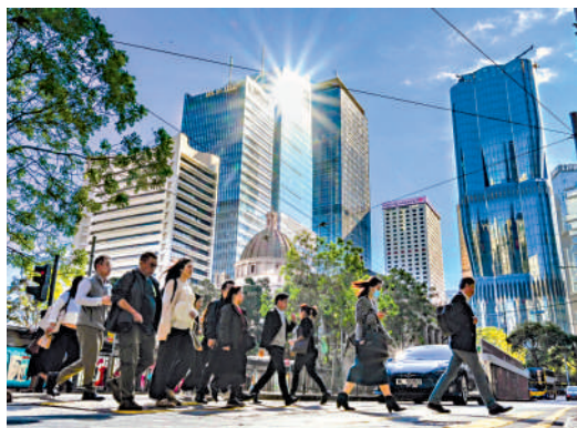
▲統計處最新數據顯示，港人就業收入中位數按年上升。

位數達到29300元。而55至59歲、60及60+年齡段的打工仔收入增長顯著，55至59歲月薪中位數從去年同期的20000元，增加至今年的21000元，漲幅為5%。60及60+月薪中位數從去年同期的16000元，增加至今年的17000元。漲幅達6.25%，在所有年齡段中增幅最為明顯。