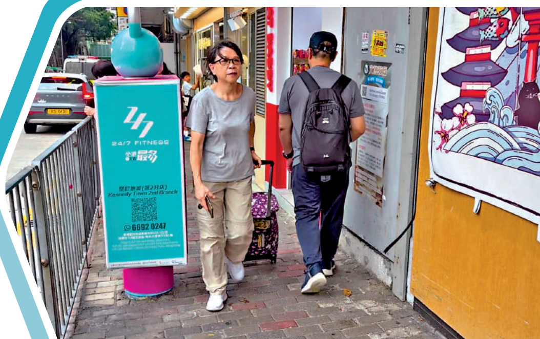
▲堅尼地城科士街，指示牌支柱設在行人路中央成為障礙。