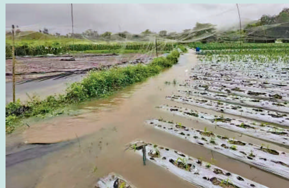
▲暴雨令農田大面積積水浸，「北都粟米節」亦告取消。