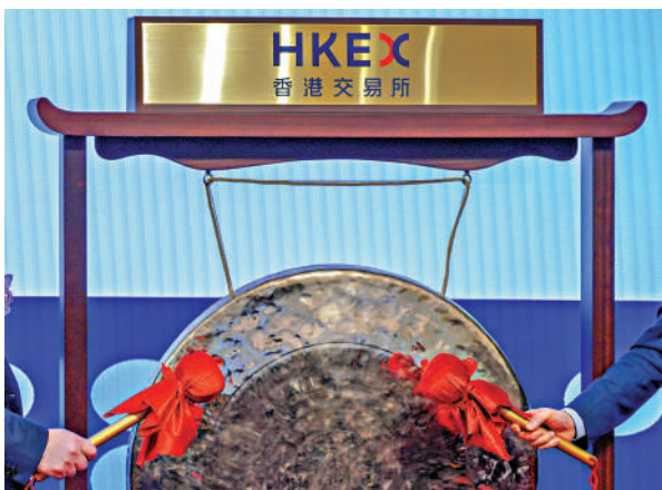
▲新股市場熱鬧，目前有 14 隻新股正等待上市。

6 隻新股於昨日截飛。以超購倍數計，中科聞歌 (01956) 一騎絕塵，孖展中購額約 1772.31 億元，超額認購 3934.85 倍；科拓股份 (02272) 緊隨其後，錄得 386.69 億元孖展資金，超額認購 965.97 倍；芯基微裝 (09630) 錄得 1826.82 億元孖展額，超購 562 倍；聖邦股份 (03661)、領益智造 (01688)，以及 MERDEKAGOLD-DRS (06228) 分別錄得 517.66 億元、379.67 億元和 6.89 億元孖展額，超額認購 111.51 倍、44.94 倍和 1.89 倍。