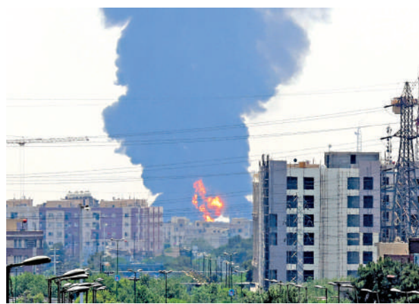
▲去年6月，伊朗首都德黑蘭南部一座煉油廠遭以色列空襲，現場濃煙滾滾。

美媒分析稱，上述臨時的石油銷售許可將為伊朗帶來價值30億美元收益。但是，美國對伊朗實施制裁多年，要解除制裁，無論在法律、政治還是商業層面上都充滿挑戰。部分制裁措施可由白宮行政命令撤銷，部分則須美國國會批准，還要與聯合國以及其他國家實施制裁的協調。國會的部分共和黨議員明確反對解除對伊朗的制裁。