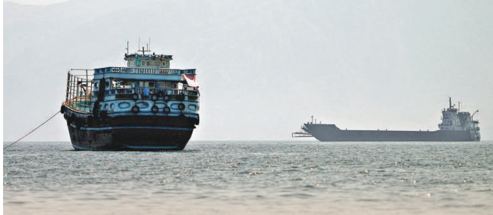
▲船舶22日停在阿曼穆桑達姆對出的霍爾木茲海峽內。

美國與伊朗上周簽署諒解備忘錄，其核心內容包括重新開放霍爾木茲海峽。然而，雙方在具體通航路線互相對立的說法，讓滯留波斯灣的船舶船東陷入兩難。伊朗方面要求船舶必須靠近該國海岸航行並支付通行費，而美國則讓船舶走受美軍空中掩護的阿曼側航線。英媒22日稱，霍爾木茲海峽通航僵局遲遲未能解套，目前仍有逾400艘大型船舶等待通航。除海峽通行問題外，美伊雙方在核問題上的說法也未能統一。