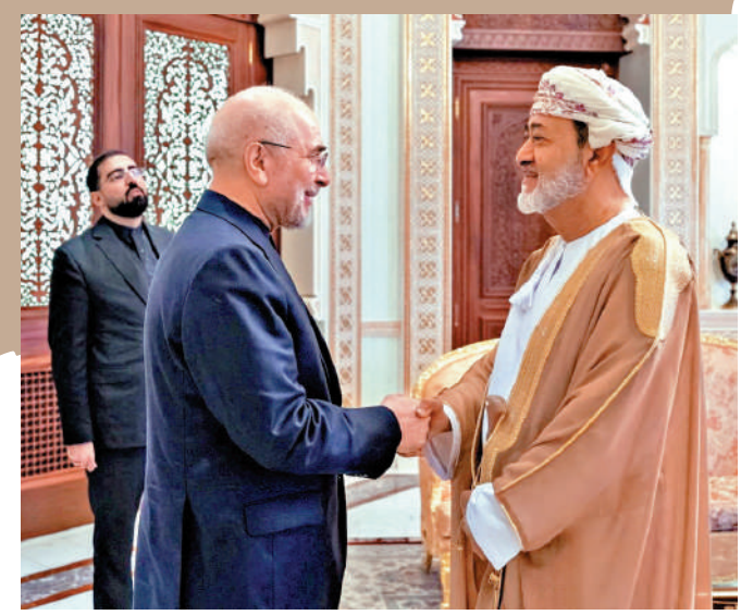
▲伊朗伊斯蘭會議議長卡利巴夫（左）23日與阿曼蘇丹海賽姆（右）在阿曼首都馬斯喀特會面。

●據三位航運業高層透露，美伊對於霍爾木茲海峽的通航指令出現分歧，令船東和運營商陷入進退兩難的困境：若聽從美國指引，可能遭伊朗當局阻撓、扣押甚或攻擊；但若遵從伊朗要求，可能違反美國制裁規定，也可能被西方保險業者認定未按照承保建議航行。