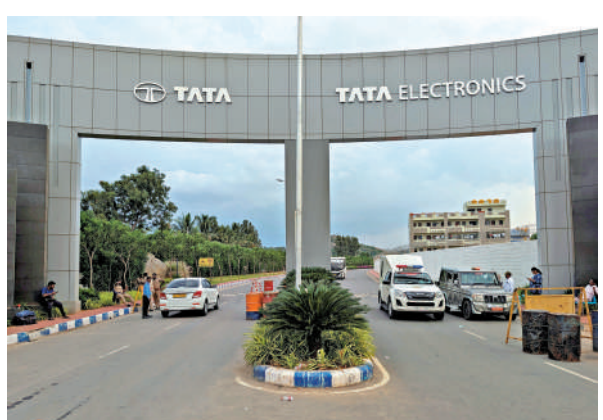
▲印度塔塔電子位於泰米爾納德邦的一家工廠，該工廠主要生產iPhone零件。