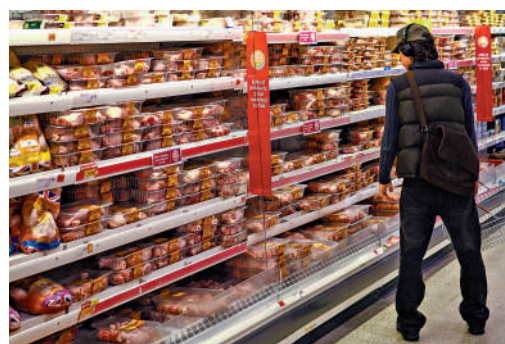
▲脫歐後，英國蒙受經濟損失，民眾也感受到物價上漲的壓力。

由地赴歐洲大陸學習和工作，普通家庭也感受到物價和能源賬單的上漲壓力。 伴隨着民意變化，英國政壇也開始公開討論重返歐盟的可能性。曾被視為斯塔默接班人選之一的前衛生大臣斯特里廷近日稱，脫歐是「災難性的錯誤」，並表示英國未來的歸宿在歐洲。保守黨內部也出現反思聲音，認為脫歐帶來的綜合損耗超出預期。事實上，去年5月舉行的脫歐後首屆英歐峰會上，斯塔默政府與歐盟已同意加強國防安全合作、放寬食品貿易限制。但英國再次換相，為英歐未來合作增加不確定性。更關鍵的是，歐盟並打算無條件與英國「復