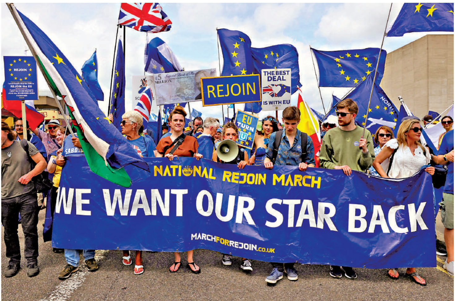
本月20日，英國民眾在倫敦遊行示威，要求重返歐盟。