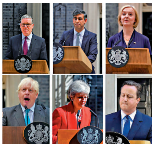
▲(上排左起)斯塔默、蘇納克、特拉斯、(下排左起)約翰遜、文翠珊和卡梅倫。

英國著名學者馬丁·雅克指出，過去10年英國社會的分裂程度為二戰結束以來最嚴重，其根源正是脫歐。脫歐分歧不只是關於歐盟成員資格的技术性討論，更折