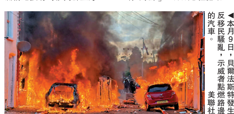
▲本月9日，貝爾法斯特發生反移民騷亂，示威者點燃路邊的汽車。

在經濟疲弱的背景下，移民問題成為英國社會最具爭議性的話題之一。不少民眾將不滿情緒投射到移民群體身上，認為他們「佔用」了住房、醫療等公共資源，還帶來治安問題。英國改革黨等極右翼勢力火上澆油，通過煽動反移民情緒拉票。本月8日，一名蘇丹裔男子在北愛爾蘭貝爾法斯特持刀刺傷一名當地居民，引發反移民騷亂。幾乎與此同時，英格蘭南安普敦也發生類似騷亂，導火索是一名白人青年被一名錫克教徒刺死的視頻曝光。