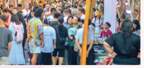
▶陶溪川打造三日三夜狂歡嘉年華，56國藝術家上鎮趕集。

西文旅（香港）推介會，發布並推介江西主題精品線路及優惠政策；舉辦贛港文旅企業對接會，開展合作洽談，推動客源互送等合作落地；在推介會現場配套舉辦「如畫江西 風景獨好」圖片展、「非遺點亮生活——影像中的江西非遺」攝影作品展，同步在香港中旅社沙田門市展出，展期一個月。走訪港中旅集團、香港中國旅遊協會等單位，洽談客源輸送、產業合作等事宜；考察香港中旅社觀塘門店等，交流文旅運營與品牌推廣經驗。