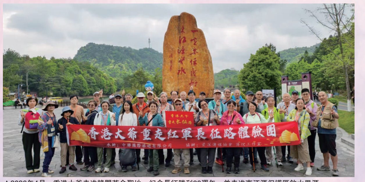
▲2026年4月，香港大爺重走紅軍長征路體驗團，紀念長征勝利90週年，並走進東江源保護區飲水思源。

西文旅（香港）推介會，發布並推介江西主題精品線路及優惠政策；舉辦贛港文旅企業對接會，開展合作洽談，推動客源互送等合作落地；在推介會現場配套舉辦「如畫江西 風景獨好」圖片展、「非遺點亮生活——影像中的江西非遺」攝影作品展，同步在香港中旅社沙田門市展出，展期一個月。走訪港中旅集團、香港中國旅遊協會等單位，洽談客源輸送、產業合作等事宜；考察香港中旅社觀塘門店等，交流文旅運營與品牌推廣經驗。