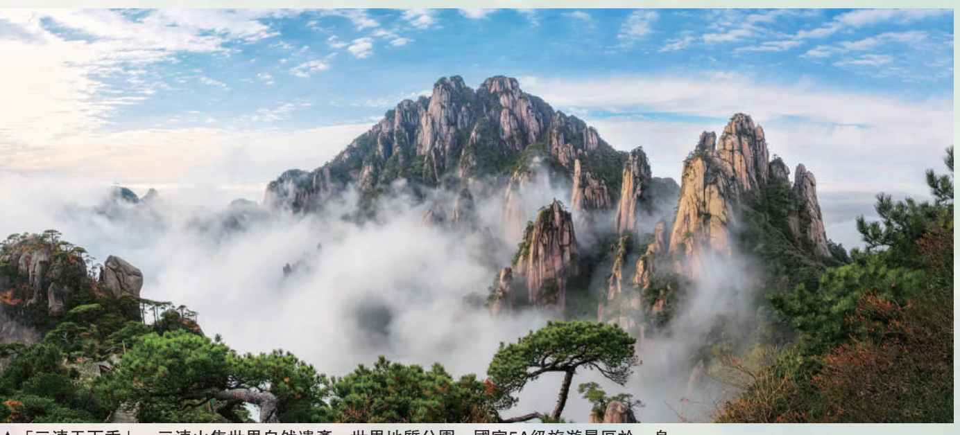
▲「三清天下秀」，三清山集世界自然遺產、世界地質公園、國家5A級旅遊景區於一身。

這些舉措看似細碎，卻恰恰構成了境外遊客對江西的第一印象——「這裏友好、便捷、值得再來」。