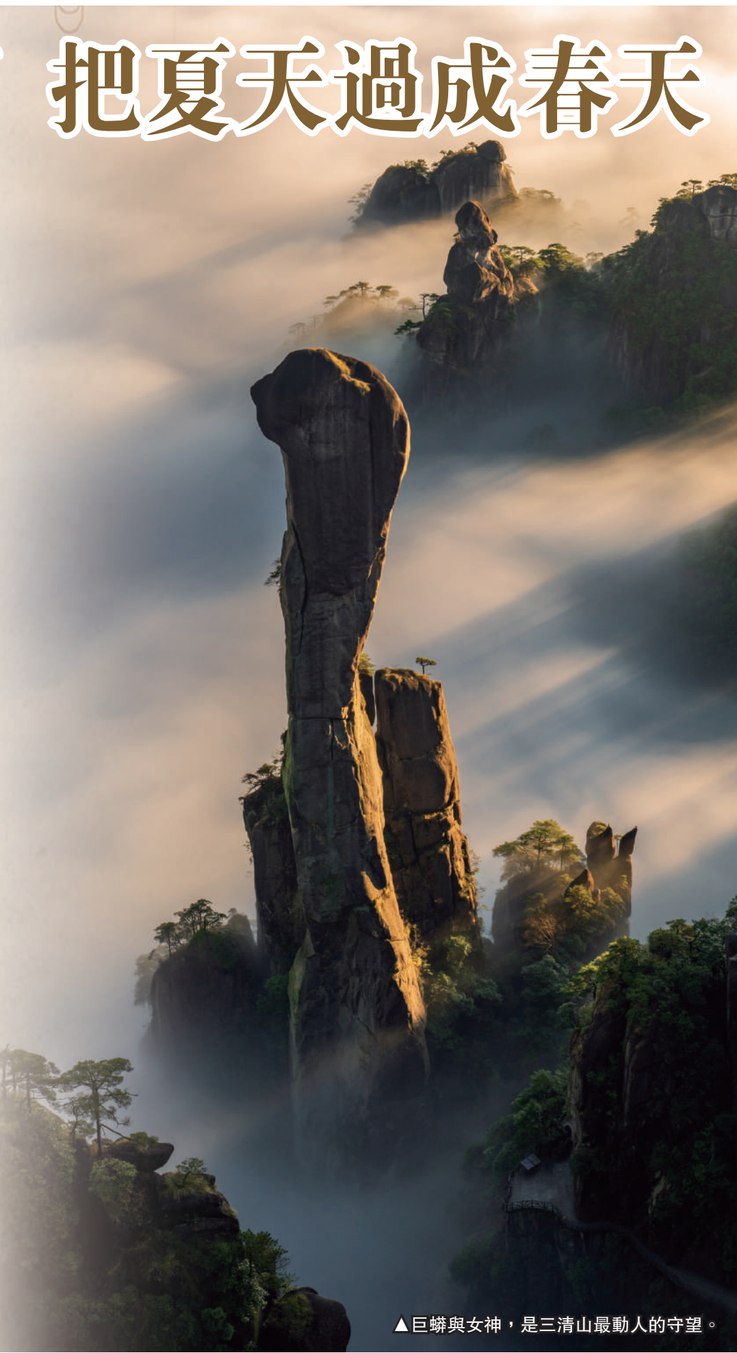
▲巨蟒與女神，是三清山最動人的守望。