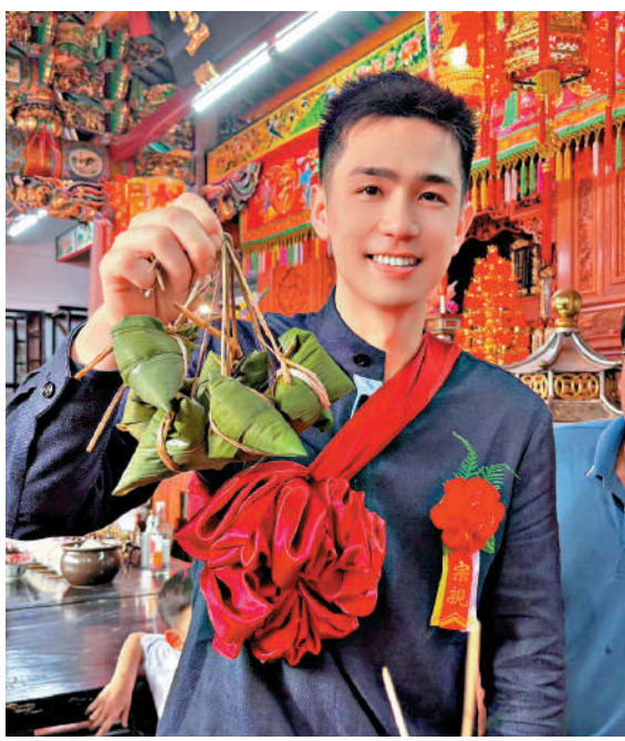
▲台灣演員利晴天在網上發放尋根視頻，在兩岸網友幫助下找到位於廣東汕頭的祖籍地。