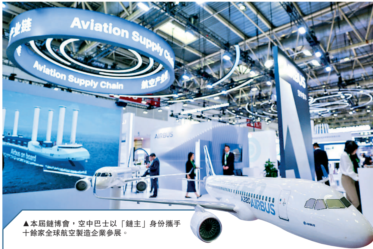
▲本屆鏈博會，空中巴士以「鏈主」身份攜手十餘家全球航空製造企業參展。