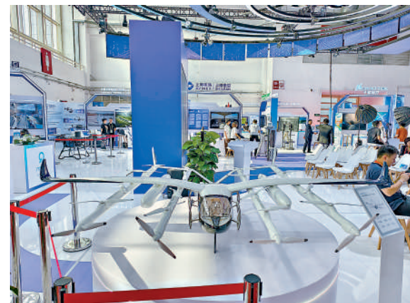
▲御風未來攜自主研發2噸級載人eVTOL M1機型亮相鏈博會。