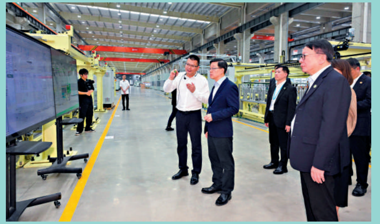
▲李家超參觀寧德思客琦智能裝備有限公司，並聽取企業代表介紹公司業務。