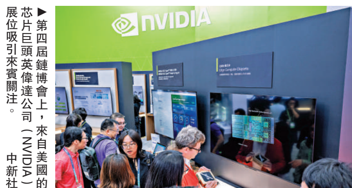
第四屆鏈博會上，來自美國的芯片巨頭英偉達公司（NVIDIA）展位吸引來賓關注。

商務部25日舉行例行新聞發布會，商務部新聞發言人何亞東應詢透露中美經貿磋商最新進展。他指出，按照中美經貿磋商達成的共識，雙方同意成立貿易理事會，並將在理事會項下討論對等降稅等合作。雙方經貿團隊將繼續保持溝通，就此開展進一步磋商。