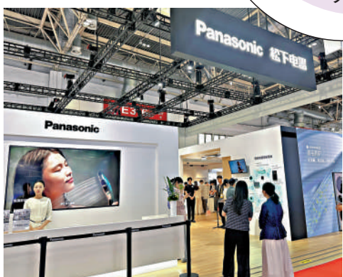
第四屆鏈博會上，日本是亞洲國家裏團組數量最多的。圖為日本松下公司展位。

府採購活動中對46家美國企業採取相關措施，是否會影響到美元首北京會晤成果，何亞東應詢表示，美國政府增列所謂的「中國軍事企業清單」做法，嚴重損害了中國企業的正當合法權益，中方不得不進行反制。上述美國企業均是涉軍企業，我們敦促美方立即停止錯誤做法，與中方相向而行，努力維護好、發展好中美建設性戰略穩定關係。