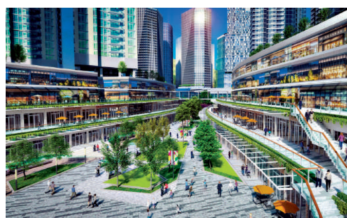
▲洪水橋／厦村新發展區可望創造約15萬個就業機會。圖為發展模擬圖。