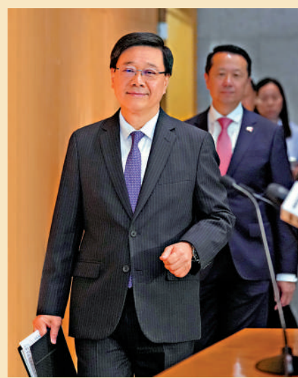
▲李家超表示，新一份施政報告將於下周一起開展公眾諮詢，同步徵集對五年規劃的意見。

公眾可以由6月29日起在施政報告網站或施政報告公眾諮詢Facebook專頁留言，也可經電郵、電話、傳真或郵寄（地址：香港添馬添美道2號政府總部西翼26樓特首政策組施政報告小組）提交意見。