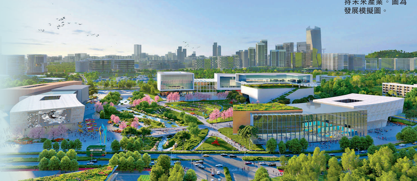
▼新田科技城是北都的核心創科引擎，將預留空間支持未來產業。圖為發展模擬圖。

新田科技城作為北部都會區的核心創科引擎，發展步伐勢如破竹。地政總署昨日就新田科技城第一期發展第二批土地張貼收地公告，收回278幅共約117公頃私人土地，有關土地將於公告張貼後三個月（即今年9月26日）復歸政府所有。