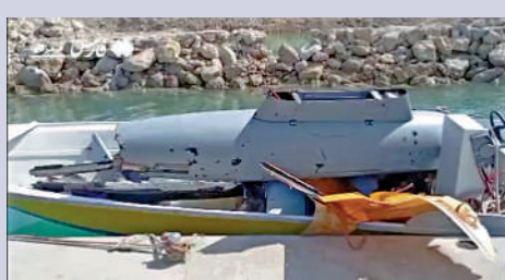
▲伊朗擊落的美軍MQ-9「死神」無人機殘骸。