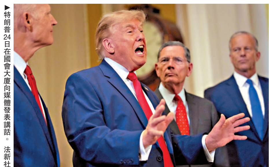
▲特朗普24日在國會大廈向媒體發表講話。

美國總統特朗普24日向國會提交一項總值876億美元（約6833億港元）的追加預算案，其中逾670億美元（約5226億港元）擬用於伊朗相關軍事行動，作為「軍事人員和戰備經費」以及「重建軍需儲備的運營成本」。此舉正值國會剛剛通過限制總統戰爭權力決議之際，立即引發兩黨強烈反彈。特朗普也因為部分共和黨議員支持限制總統戰爭權力的決議發怒，與支持決議的共和黨參議員爆發激烈爭吵。