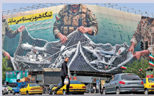
▲伊朗首都德黑蘭街頭的一個廣告牌，上面畫着損毀的美國戰機。