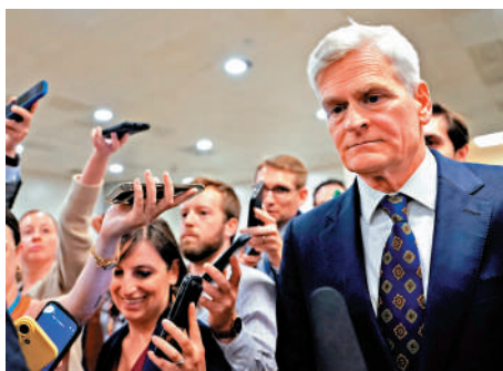
▲共和黨參議員卡西迪24日在國會接受採訪。

美媒指出，美國國防部2026財年預算總額約1萬億美元，伊朗戰事爆發後不久，國防部就要求白宮批准其向國會提