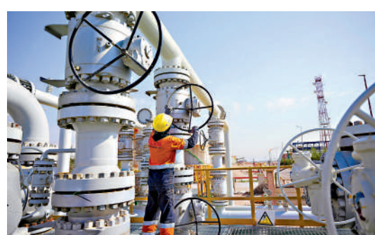
▲一名工人在伊拉克魯邁拉油田操作閘門。

伊朗伊斯蘭革命衛隊海軍25日發表聲明，要求所有船隻通過霍爾木茲海峽時須與伊方協調，違規者「將受到處置」。此前有機構未經協調擅自宣布船舶通過了新航線，革命衛隊