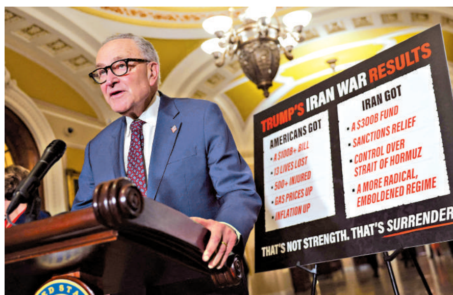
▲美國參議院民主黨領袖舒默23日在國會見記者，並展示特朗普政府在伊朗戰爭中的損失。

美國總統特朗普24日向國會提交一項總值876億美元（約6833億港元）的追加預算案，其中逾670億美元（約5226億港元）擬用於伊朗相關軍事行動，作為「軍事人員和戰備經費」以及「重建軍需儲備的運營成本」。此舉正值國會剛剛通過限制總統戰爭權力決議之際，立即引發兩黨強烈反彈。特朗普也因為部分共和黨議員支持限制總統戰爭權力的決議發怒，與支持決議的共和黨參議員爆發激烈爭吵。