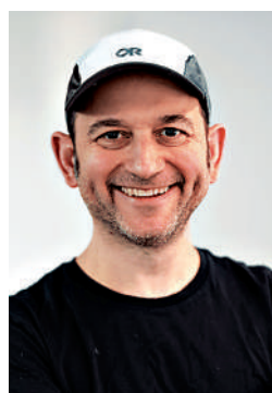
▲谷歌工程副總裁兼Gemini模型共同負責人沙澤爾。