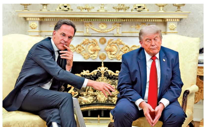
▲特朗普（右）24日在白宮會見北約秘書長呂特。

呂特當天自備圖表道具，稱讚特朗普上任後，北約國防開支大升，還自創新詞「特朗普萬億」形容北約歐洲國家和加拿大防衛費大幅增加萬億美元，以此討好特朗普。他對特朗普極盡吹捧，「他們想聽你（特朗普）的領導」。《金融時報》稱，在歐洲，呂特已被視為特朗普的「傳聲筒」。