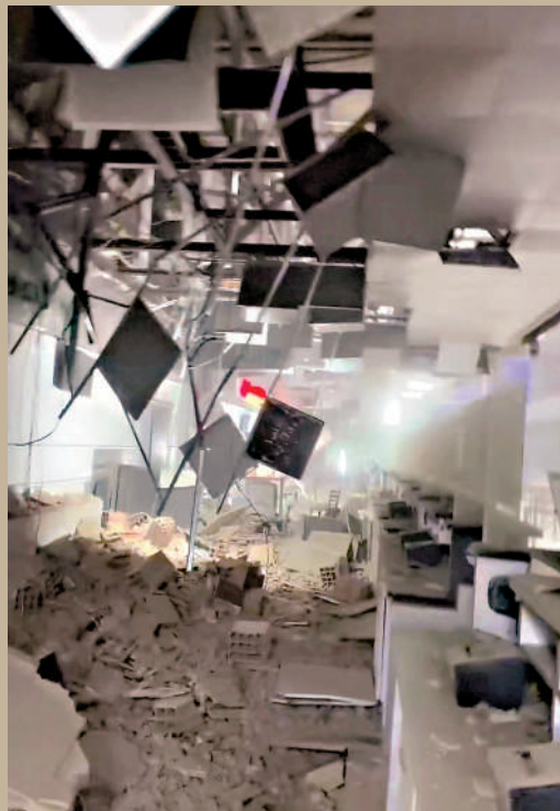
▲邁克蒂亞西蒙·玻利瓦爾國際機場天花板在地震中坍塌。