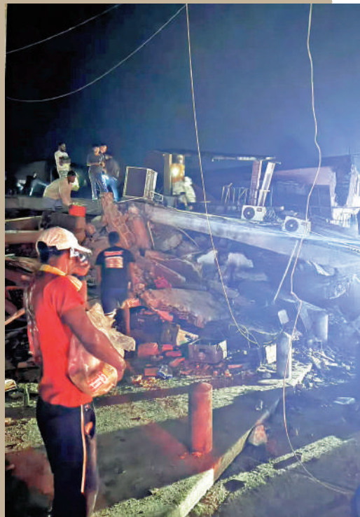
▲委內瑞拉24日接連發生兩次強震。

當地時間24日傍晚，委內瑞拉北部在一分鐘內連續發生兩場7級以上強震，此後餘震不斷，目前造成至少164人遇難、971人受傷。外界預計死亡人數可能進一步增加，身處委內瑞拉首都加拉加斯的華人良叔告訴大公報記者，突如其來的強震造成當地多處建築受損，「目前我們一家平安，不過每當夜晚仍然不敢熟睡」。當地華人華僑正在組織救援力量搜救其他被困的僑胞。中國外交部發言人郭嘉昆25日表示，中方願根據委方需要提供幫助。委內瑞拉代總統羅德里格斯對中方表示感謝。