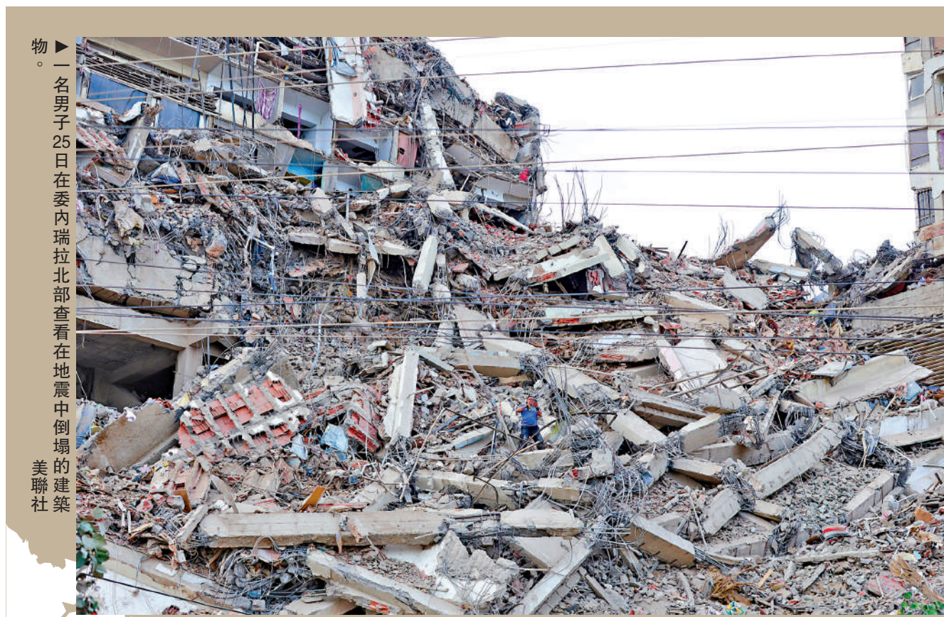
一名男子25日在委內瑞拉北部查看在地震中倒塌的建築物。