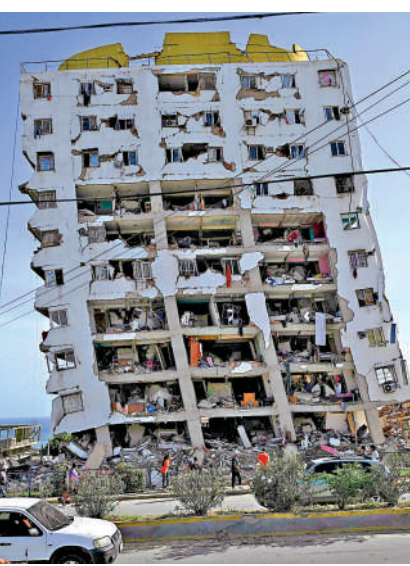
▲委內瑞拉一棟公寓樓在地震中受損。