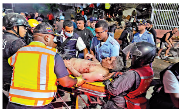
▲救援人員24日在加拉加斯救出一名傷者。

當地時間24日18時左右，委內瑞拉北部發生7.2級地震，不到一分鐘又發生7.5級地震，震源深度10公里。兩次地震震中相距不遠，首都加拉加斯等多地受災，大片建築物倒塌。截至25日晚最新消息，地震遇難人數已升至164人，受傷人數升至971人。受地震影響，加拉加斯附近的邁克蒂亞西蒙·玻利瓦爾國際機場建築結構損毀嚴重，現已關閉。