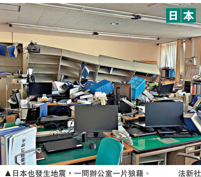
▲日本也發生地震，一間辦公室一片狼藉。