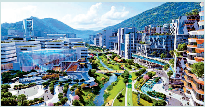
政府昨日舉行專上教育界諮詢會，集中討論北都大學城發展的具體方向。圖為北都大學城發展規劃圖。

教育界指出，大學城規劃方向清晰，將依靠北部都會區打造國際專上教育樞紐，包含教育、科技、人才、產業、城市發展五個核心元素，在推動教育、科技、人才一體化發展的同時，回應國家「十五五」規劃對香港定位的要求。雷添良強調，規劃具彈性，框架不會限制院校在大學城的發展模式，充分尊重院校自主，各大學可根據自身辦學使命和學科優勢提出發展方案。他續稱，政府計劃中的北都大學城區面積達1000公頃，與會院校代表亦支持這種發展模式，認為需要完整的生態圈才能吸引國際人才和機構落戶。至於大學城發展的