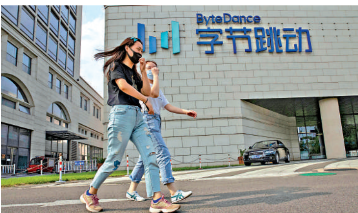
▲字節跳動以32600億元人民幣價值，在全球獨角獸榜單中位列第三。

《2026全球獨角獸榜》數據顯示，今年全球獨角獸企業數量較去年增長5.3%，達1603家創下歷史新高；全球獨角獸企業總價值較去年增長43%，達54萬億元(人民幣，下同)。全球獨角獸企業排名中，前三名均布局大模