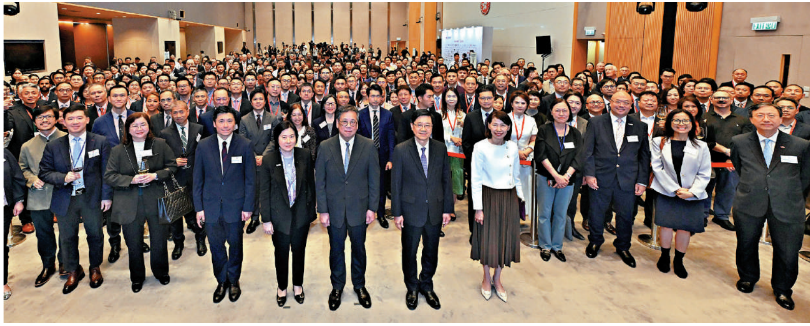
►李家超（左二）、商務及經濟發展局局長丘應樺（右二）、行政長官辦公室主任葉文娟（左一）和劉凱旋（右一）在企業來港發展歡迎會上祝酒。

投資推廣署署長劉凱旋在致辭時表示，香港始終致力打造優質營商環境，未來也會全力以赴，扶持企業家立足香港、走向全球，依託香港多元專業服務開拓國際市場。該署將緊扣國家「十五五」規劃及施政報告的焦點，重點吸引創新科技與新經濟企業來港，包括從事人工智能、生命健康、可持續發展等業務的企業；深化「金融+」的策略部署，為香港市場注入來自金融服務及金融科技的新資本，及深化全球招商布局，加快吸引內地企業來港部署出海，並深耕歐美成熟市場，以及開拓「一帶一路」沿線新興市場，擴大行政長官本月初出訪中亞的豐碩成果。