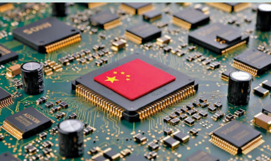
▲中國的戰略是高端產品在追趕的同時，先搶佔中低端市場，以奠定在芯片市場的重要角色。

在搶佔中低端市場的同時，中國同時在高端芯片開發上奮力邁進，且又兵分兩路。其一是從後沿路追趕，其二是繞道超前，兩者並行既可分擔風險，又可在未來會師後尋找適當的分工互動。具體情況容後再談。