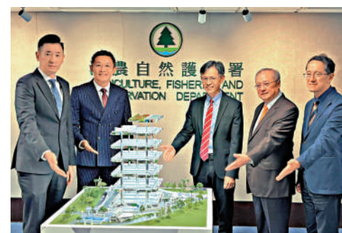
▲漁護署昨日公布，建華農牧獲選為香港首個多層式環保養豬場項目的營運機構。

建華農牧（香港）有限公司的母公司是上市公司建華集團。該集團早前投得政府的大鵬灣（南）新魚類養殖區深海養殖項目。政府表示會繼續與業界攜手，推動本地禽畜業以集約化及現代化模式發展，促進香港農業可持續經營及發展。