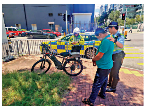
▲警方拘捕涉嫌違法使用電動單車人士。

【大公報訊】記者馮錫雄報道：警方打擊電動單車相關罪行，一連五日在西九龍區首次用無人機執法，拘捕54人，年齡介乎