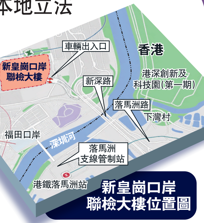
新皇崗口岸聯檢大樓位置圖

全國人大常委會委員、立法會主席李慧琼表示,是次決定明確授權香港特區在內地特定區域行使管轄權,並清晰界定授權區域及期限,為新皇崗口岸高效、安全、有序運作提供堅實法律基