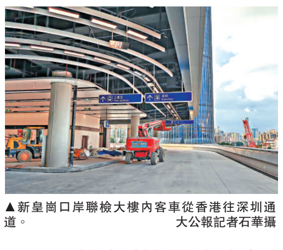
▲新皇崗口岸聯檢大樓內客車從香港往深圳通道。