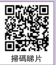
大公報記者 吳俊宏、石華、實習記者黃穗報道

在前海創業的港青向大公報記者表示「好期待!」新皇崗口岸快至「5分鐘通關」,今後穿梭深港更方便。