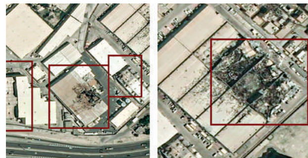
▲衛星圖像顯示，位於巴林的美國海軍基地多處設施嚴重受損。網絡圖片