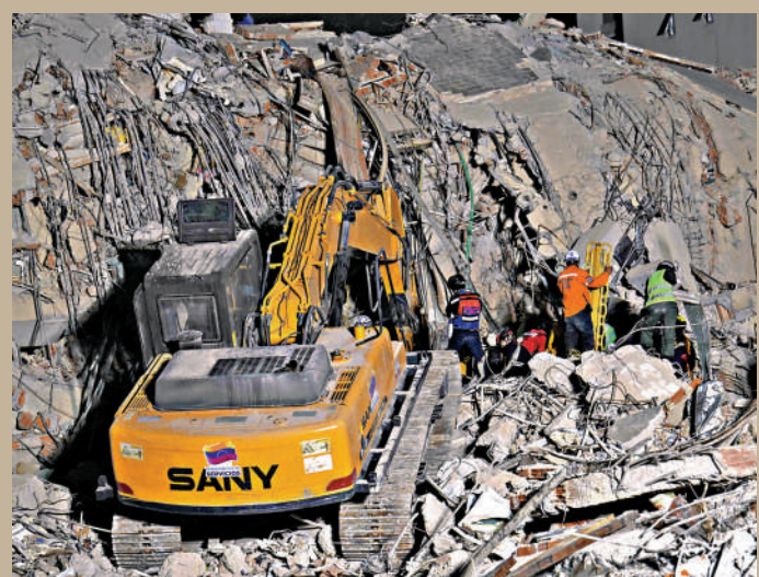
▲委內瑞拉首都加拉加斯受災嚴重，救援人員操作重型機械進行搜救。