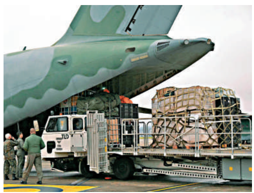
▲巴西向委內瑞拉運送的部分救援裝備和物資。

除中國外，多國和國際組織也紛紛伸出援手。巴西宣布派遣一支專業救援隊協助震後救災，並將向災區運送用於搭建野戰醫院的設備、100台太陽能淨水器以及醫療物資。哥倫比亞派出60多名救援人員並運送12噸人道援助物資。薩爾瓦多將派遣300名救援人員與醫護人員，以及50噸裝備、藥品和救援物資。