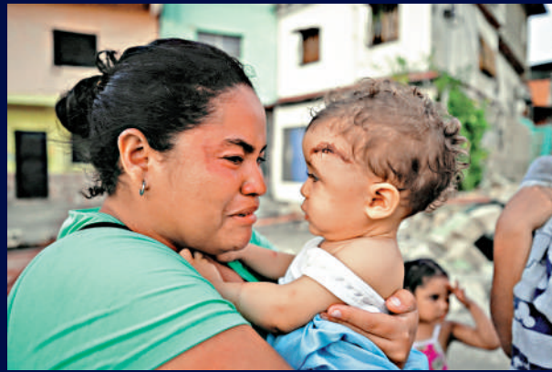
▲拉瓜伊拉州發生地震後，一名婦女抱着受傷傷童，神情激動。