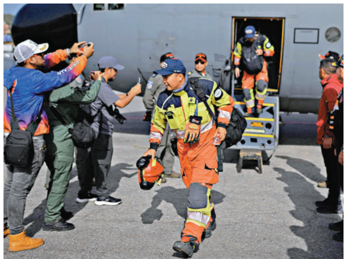
▲厄瓜多爾搜救人員26日抵達委內瑞拉。

在如此巨大的天災面前，委內瑞拉政府因長期遭美國制裁，導致國內經濟嚴重萎縮、通脹高企，救災及災後重建能力都受到極大削弱。聯合國人道主義事務機構信息顯示，截至5月，委內瑞拉2800萬人口中近800萬人需要援助。