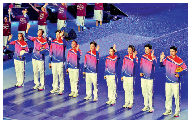
▲（左起）唐佳麗、仲慧、覃海洋、鍾天使、樊振東、吳敏霞、陳雲霞、謝文駿、顏鵬作為優秀運動員代表亮相。

吳敏霞表示，同樣是四年一屆，從國際角度是奧運會，從城市角度那就是市運會，「堪比是自己地區的一個奧運會了。」吳敏霞說，如今的市運會儀式感越來越重了，不僅有開幕式，也加強了宣傳，這都讓運動員們更加想要做好準備，在比賽中發揮出更好水平。