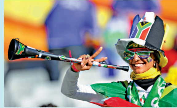
▲南非球迷在2010年世界盃使用「巫巫茲拉」，為支持的球隊打氣。