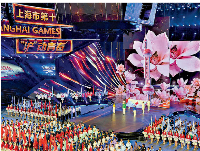
▲上海市第十八屆運動會開幕式27日在上海體育館舉行。