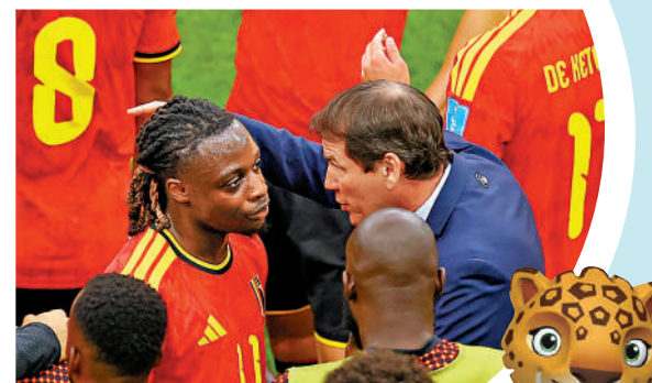
▲比利時主帥魯迪加西亞（右）向杜古面授機宜。

但也有觀點表示，這一窗口為教練提供了戰術調整機會，增加了比賽懸念。比利時隊主帥魯迪加西亞表示，這個時段可以補充布置戰術指令。即使對這一新規提出異議的