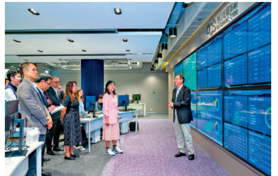
▲陳美寶早前到訪港口社區系統控制中心。

陳美寶強調，香港一直憑藉「一國兩制」優勢、自由市場、簡單稅制、普通法制度及「背靠祖國、聯通世界」的獨特地位，深受國際企業青睞。未來特區政府將繼續善用這些優勢，配合創新科技和制度創新，推動航運業高質量發展，朝着建設「全球航運之都」的目標穩步邁進。