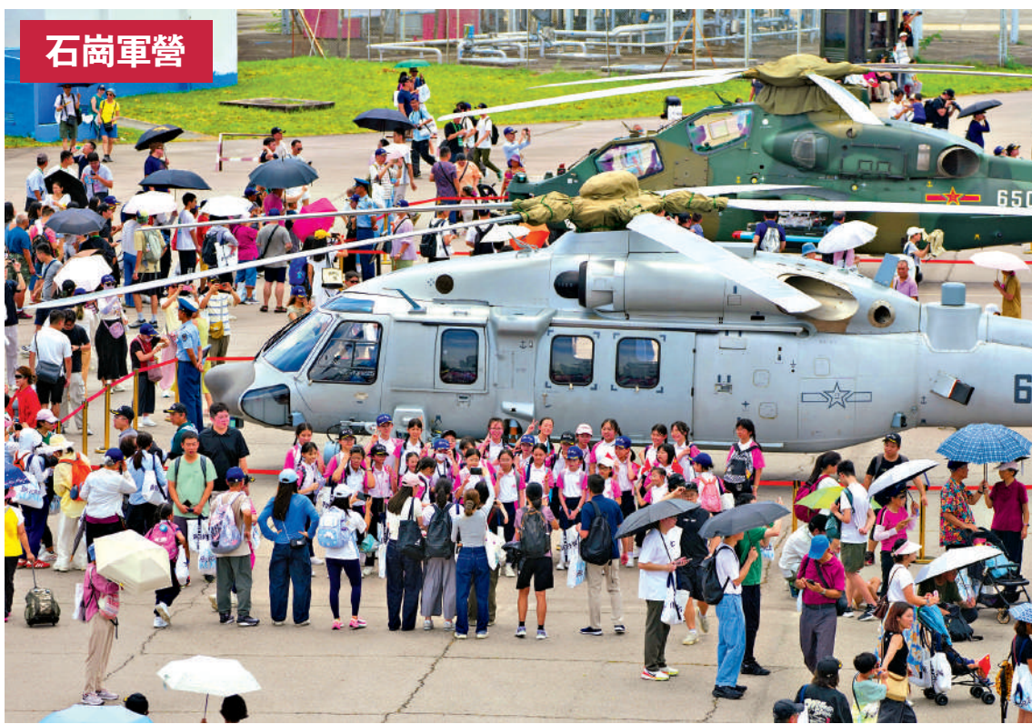
▲石崗軍營開放日，市民近距離參觀防空武器系統。

直升機飛行表演現場人潮湧動，大批市民駐足觀賞。伴隨轟鳴聲，三架國產直升機依次升空，完成超低空掠地、蛇形機動、空中躍升等高難度特技動作，還演繹空中編隊與索降突擊科目。戰機凌雲、動作利落，精湛飛技引來滿場歡呼掌聲，市民紛紛舉機記錄，近距離感受駐港部隊過硬戰鬥實力。