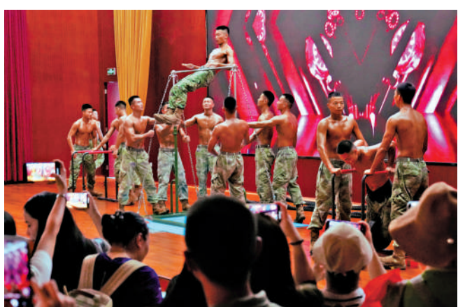
▲新圍軍營內各類演練都令市民大開眼界。

【大公報訊】新圍軍營昨日亦同步對外開放，營區內各類軍事展演輪番登場，現場氛圍熱烈。活動涵蓋升旗儀式、槍械儀仗、近身格鬥、刺殺操、獵人戰鬥等多項特色展示，特戰隊員現場展示各項軍事本領，引得到場市民駐足觀賞。