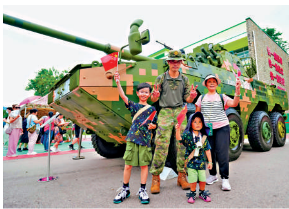
▲新圍軍營解放軍官兵與市民親切合照。