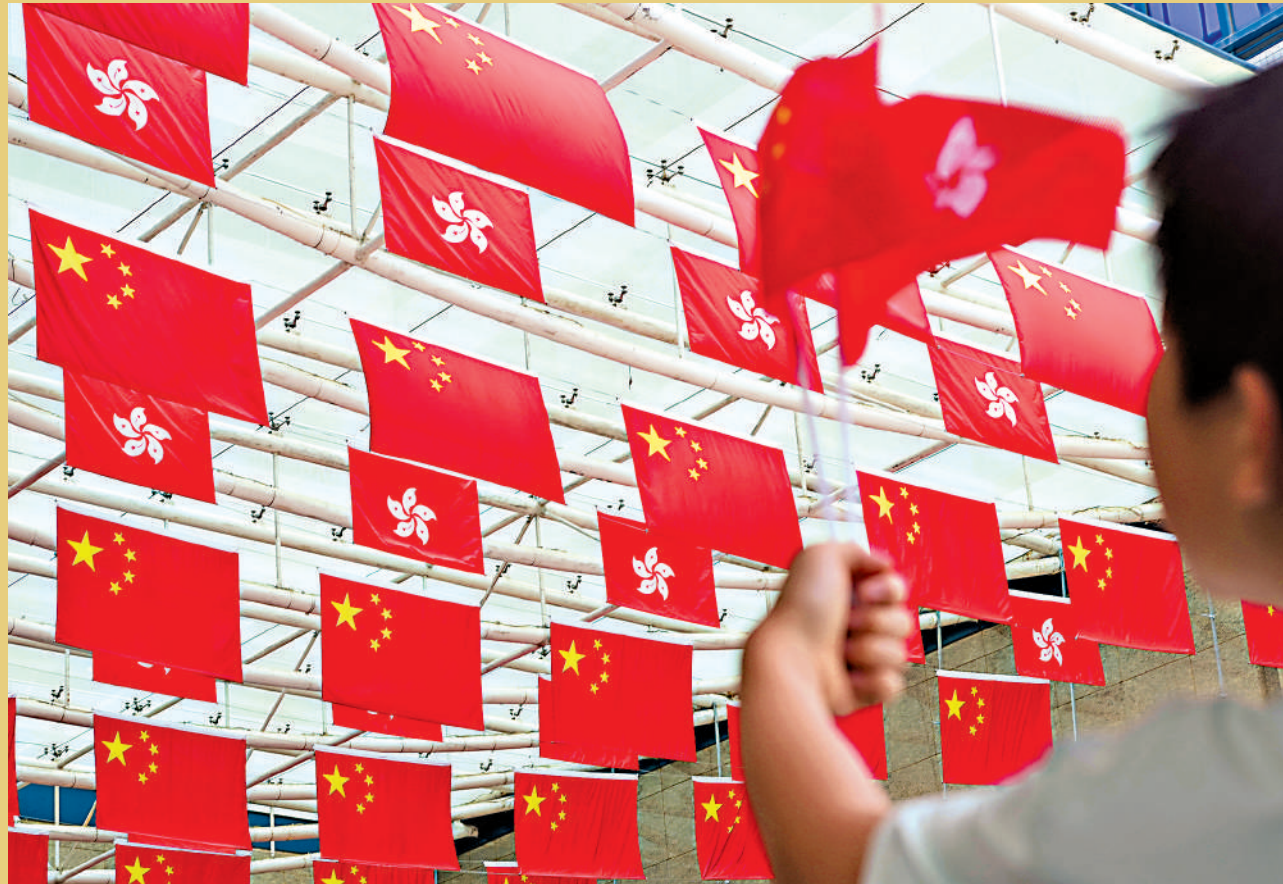
◀香港回歸祖國二十九周年，全港各處掛上慶祝標語。