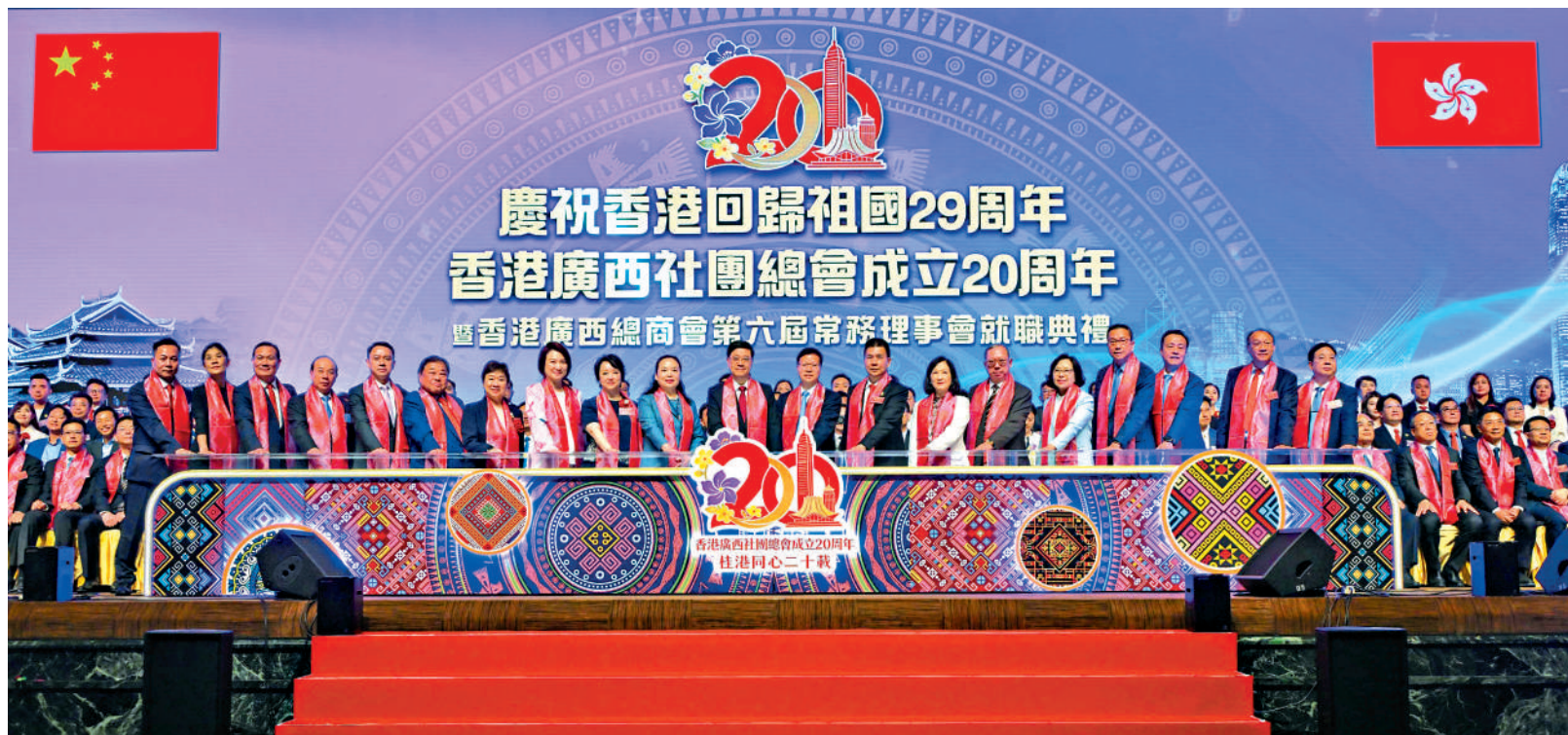
▲「慶祝香港回歸祖國29周年、香港廣西社團總會成立20周年暨香港廣西總商會第六屆常務理事會就職典禮」昨日舉行。