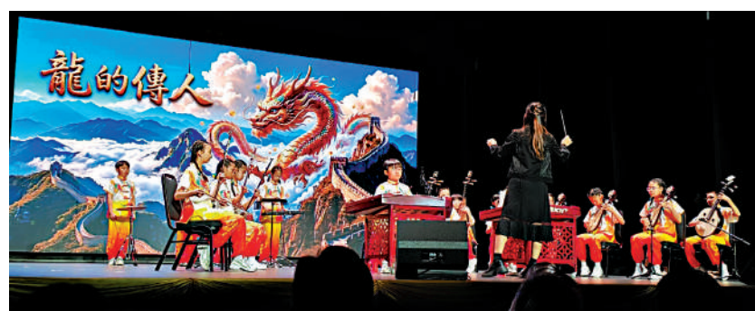
▲青少年在「藝萃躍動」活動中拉奏中式樂器。