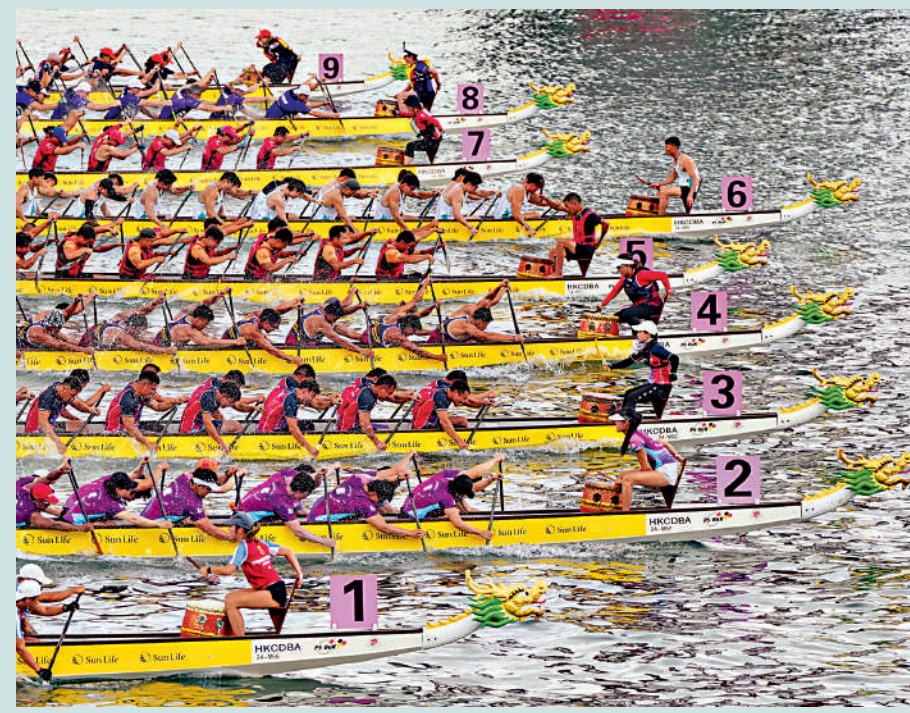
▲逾4500名來自海內外的龍舟健兒在維港揮槳競渡。