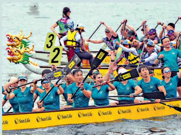
▲各地隊伍一同切磋，增進友誼。