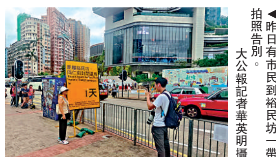
昨日有市民到裕民坊一帶拍照告別。

市建局稱，工程完成後，根據早前已獲批准的規劃，裕民坊及同仁街將分別改作綠化休憩空間及項目基座，實現人車分隔。至於相關街道的