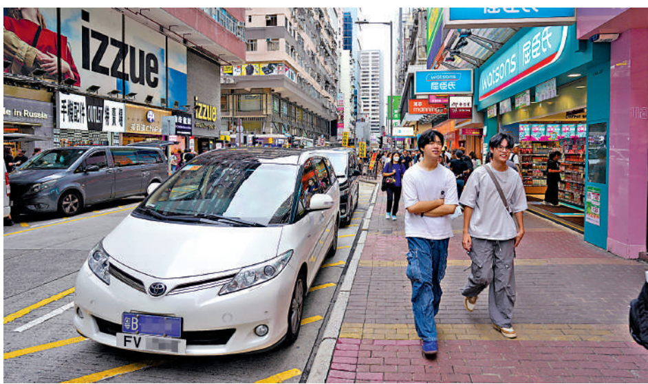
▲香港多區可見「粵車南下」私家車停泊。

大公報記者於昨日周末下午在金鐘一帶的告士打道觀察，10分鐘內已有2架懸掛粵A及FT車牌的「粵車南下」私