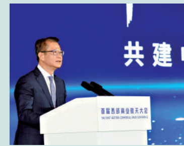
▲陳茂波表示，香港賦能西部航空崛起，助力國家商業航空天布局。

其次從科研維度看，香港高校在基礎研究與國際學術網絡方面都具備優勢，與西安院校在研究、轉化應用和國際聯繫上可以協同發展、攜手攻關。最後從市場維度看，香港依託普通法體系、國際接軌的知識產權保護制度，以及覆蓋全球的專業服務網絡，能夠為西部企業的技術和產品輸出以及海外業務拓展提供「規則接口」。陳茂波表示，「這三個維度，是對西部縱深效益的放大。這個合作是雙向的深度合作。」