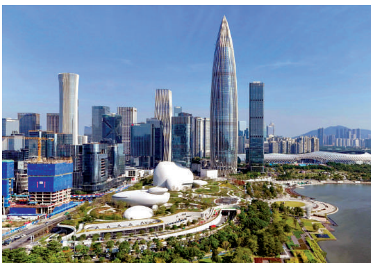
▲APEC將進一步強化深圳作為亞太區域合作樞紐的地位。