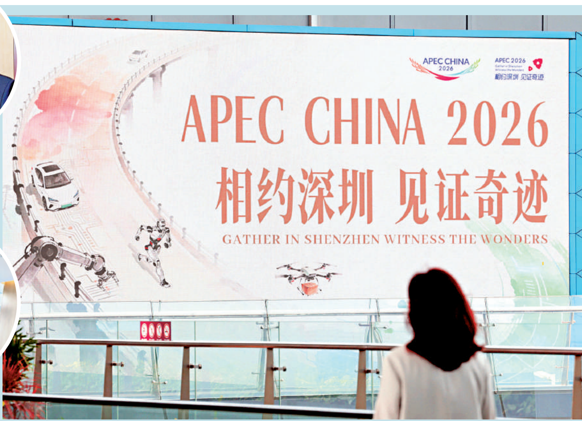
▲APEC峰會將於11月中旬在深圳舉行，這座改革開放的前沿城市再次成為全球焦點。