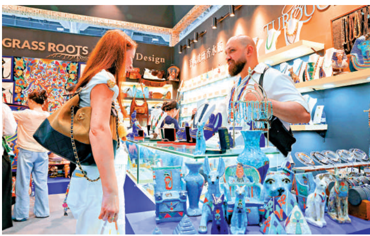
▲儘管全球經濟形勢複雜多變，深圳吸引外資的勢頭仍然強勁。