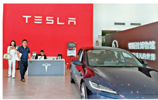
▲深圳是特斯拉在中國最重要的戰略市場之一。

深圳更是特斯拉在華南布局的重鎮。2014年，華南首家特斯拉體驗中心落戶深圳。截至目前，特斯拉在深圳已累計開設超過40家門店，建成超過60座超級充電站和15座目的地充電站，門店布局密度位居全國前列。其中，深圳僑城坊站點以188根充電樁，成為全國最大的特斯拉目的地充電站。