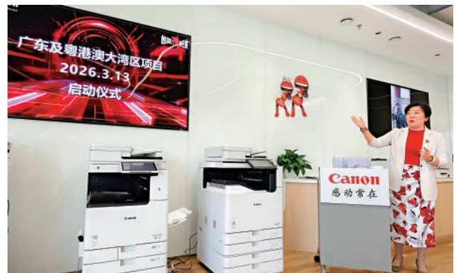
▲佳能看好大灣區產業鏈完備的優勢，在深圳建有生產工廠。

展望未來，佳能（中國）希望將研發、生產、銷售、服務等多維功能在深圳有機整合，為客戶提供更優質的技術、產品、解決方案與服務。這不僅將促進佳能（中國）業務穩步增長，更將助力其實現到2035年成為佳能集團中「NO.1」的遠景目標。