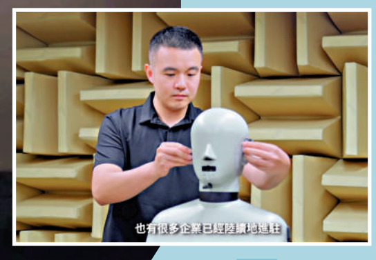
河套香港園區第一期大樓陸續落成