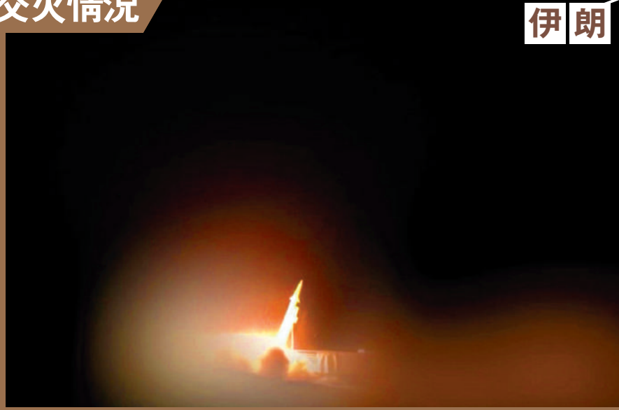
▲伊朗伊斯蘭革命衛隊28日公布發射導彈打擊美軍目標的畫面。