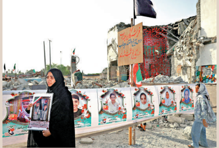
▲米納卜小學的廢墟附近貼着遇難兒童的照片。