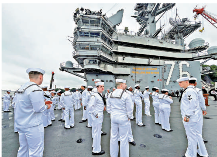
▲美軍「里根」號航母上藏着一個毒品犯罪網絡。

今年1月，駐日美軍橫濱基地也曾曝出涉毒醜聞，一名44歲的船舶修理工被指控從美國走私共計約278克含有毒品成分的軟糖和膠囊等物品。