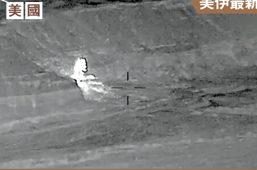
▲美軍中央司令部27日公布襲擊伊朗境內目標的畫面。

美國 美軍中央司令部27日稱，當天對伊朗境內多個目標實施打擊，包括伊朗的軍事監視設施、通信系統、防空陣地、無人機儲存設施以及布雷裝備等，理由是伊朗再次在霍爾木茲海峽附近襲擊一艘油輪。 當天晚些時候，美軍中央司令部稱，對伊朗在霍爾木茲海峽及其附近多地的10個軍事目標實施打擊。