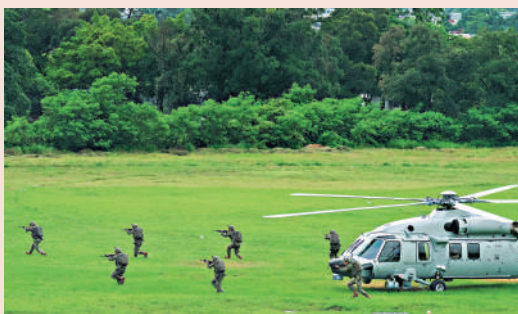
▲駐港部隊官兵乘坐直升機表演空降搶攻技巧。