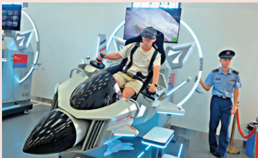
▲模擬駕駛體驗，不論大人小朋友一樣玩得十分開心。