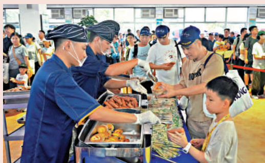
▲駐港部隊官兵為參觀市民準備了小食，盡展關懷。