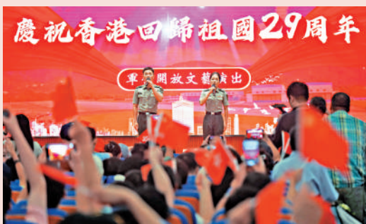
▲駐港部隊官兵為市民獻唱歌曲，展示多才多藝的一面。