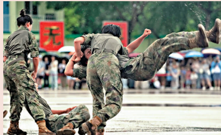
▲▼在新圍軍營，駐港部隊官兵向市民展示模擬作戰及徒手格鬥技術，現場一片掌聲。

為慶祝七一香港回歸祖國29周年，駐港部隊舉辦多個軍營開放活動。昨日是新圍、石崗軍營開放最後一日，雖然天氣不好時不時下雨，但各項軍事演練、室內文藝活動仍有序開展。