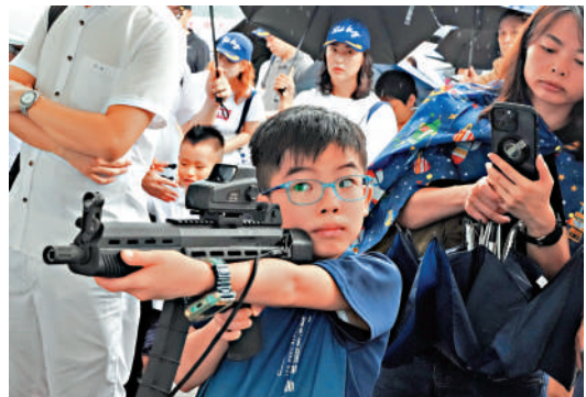
▲有親身體驗模擬射擊的學生事後驚嘆：「原來槍真的很重。」