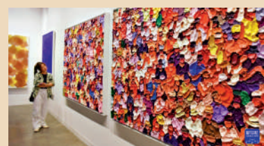
▲2026年巴塞爾藝術展香港展會。

今年首季錄得 1431萬 旅客訪港，按年增17%，其中內地旅客佔 1108萬 人次，按年多20%。