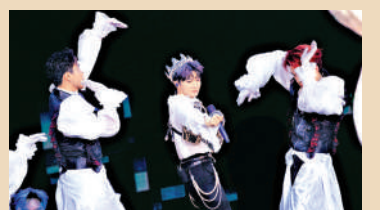
▲周深在啟德體育園主場館舉辦跨年演唱會。

原創音樂劇《大狀王》2025年3站演出53場吸引 65000名 觀眾入場，上海、北京兩站吸引逾 35000名 內地觀眾入場欣賞，香港站吸引接近 29000名 觀眾入場，其中內地觀眾佔香港站觀眾總人數逾三成。