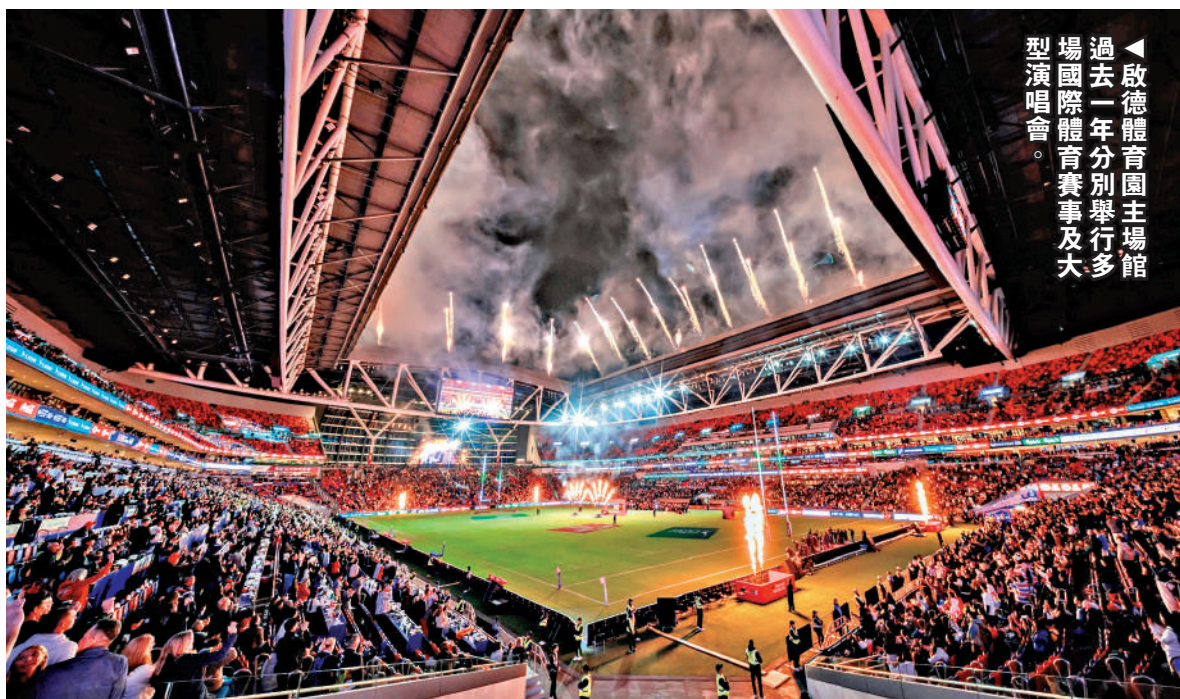
▲啟德體育園主場館過去一年分別舉行多場國際體育賽事及大型演唱會。