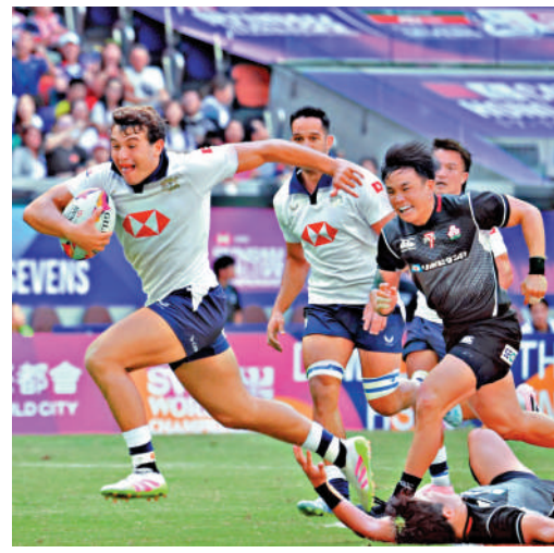
▲香港國際七人欖球賽吸引不少旅客來港觀賽。