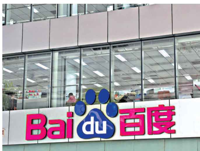
▲百度昨日股價跑贏大市，市值升至近 3000 億元。