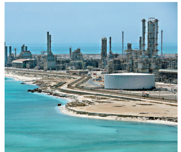
▲拉斯塔努拉是沙特阿美一座大型煉油廠所在地。

國際清算銀行28日發布報告說，中東戰事引發能源及其他原材料供應危機，對全球經濟前景構成新的威脅。儘管當前地緣政治緊張局勢有所緩解，但此次衝擊造成的影響可能長期存在。