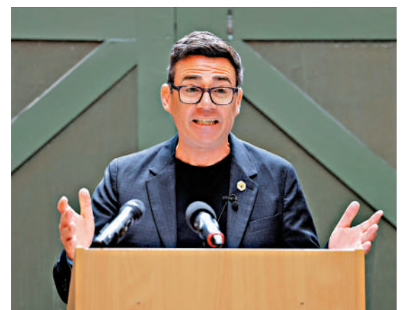
▲伯納姆29日在曼徹斯特發表演講，提出打造「北方唐寧街10號」。

繼續擔任英國首相。工黨將於7月9日啟動黨魁選舉提名程序。英媒披露，斯塔默正考慮未來角逐北約秘書長一職。該職位目前由荷蘭前首相呂特擔任，其任期將於2028年屆滿。除非所有北約成員國一致同意延長呂特任期，否則北約秘書長職位將出現空缺。新秘書長的遴選將以成員國之間非正式外交磋商形式展開。