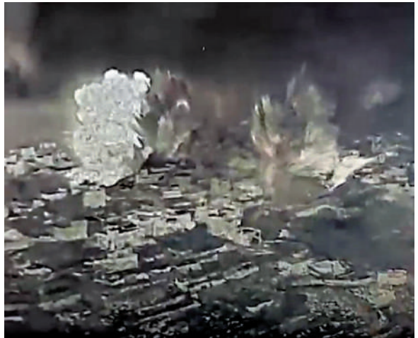
▲以色列28日打擊據稱是「黎巴嫩真主黨地道」的目標。 視頻截圖

伊朗總統佩澤希齊揚29日說，伊朗在卡塔爾被凍結的120億美元資金中，將有60億美元凍結並還給伊朗。據悉，此次凍結的60億美元來源於2023年美伊達成的換囚協議，協議允許伊朗將被凍結在韓國銀行的60億美元石油款項轉到卡塔爾。美國當時規定，這筆資金僅能用於購買食品和藥品等人道