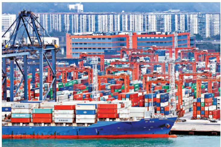
▲受惠全球對科技產品的需求持續強勁，香港今年出口預計可達雙位數增長。