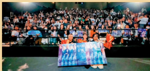
▲《寒戰1994》早前在內地舉辦多次謝票活動。

對於引進劇，未來允許香港製作的引進劇經廣電總局批准後在內地廣播電視台的黃金時段播出，為香港電視劇進入內地市場提供更大的發展空間，推動兩地文化的深度融合。此外，協議還允許香港的地面衛星電視頻道經廣電總局批准後，在境內酒店、賓館等特定範圍內落地播出，增加地面和衛星電視頻道在內地發展的機會。