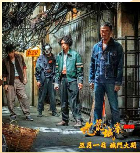
▲陳大利是電影《九龍城寨之圍城》的編劇之一。