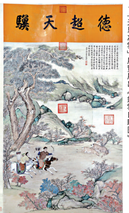
▲「天馬凌雲」展覽展出《錦雲良駿圖》。

此外，於今年3月揭幕的「天馬凌雲——故宮博物院藏繪畫珍品」（「天馬凌雲」）是香港首個以馬為主題的大規模中國歷代繪畫展覽。「天馬凌雲」展覽於6月中旬推出第二期共24件全新珍品。第二期焦點藝術珍品包括：《錦雲良駿圖》《霜崖眺雁圖》《雪山行旅圖》。「天馬凌雲」由香港故宮館與故宮博物院聯合主辦。展覽共分四期，每期約三個月。第二期展期為即日起至9月14日。