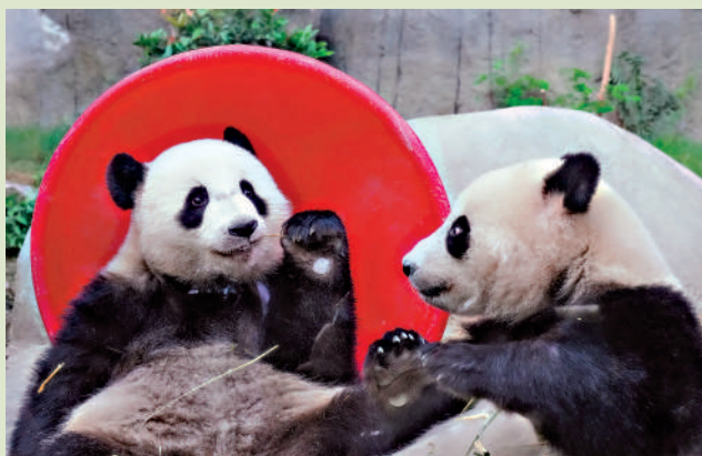
▲港產大熊貓加加、得得下月迎來兩歲生日。

海洋公園主席龐建貽表示，園方會持續參與大熊貓保育工作，並向市民推廣相關信息，帶動園區人流。龐建貽指出，水上樂園自上月中重開，入場人次較去年同期升16%。園方在未來兩個月將設水上排球及水上瑜伽等新設施。