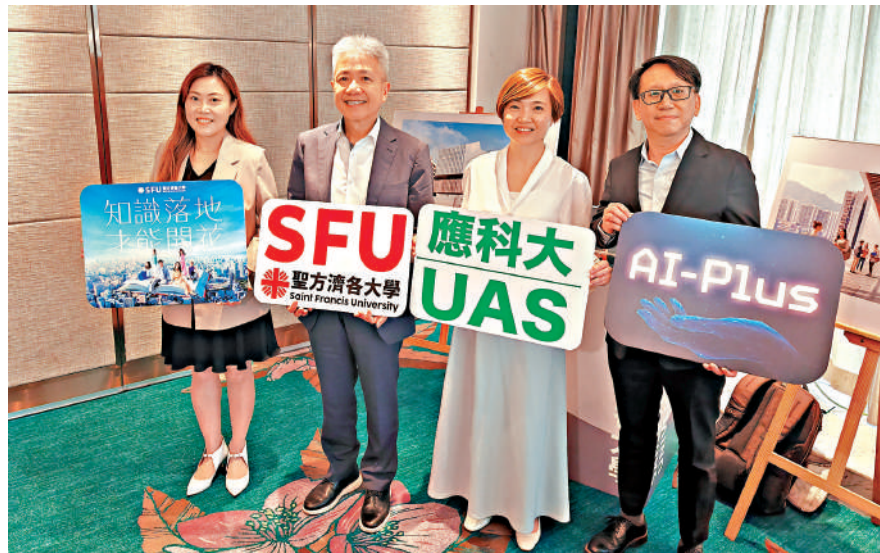
▲聖方濟各大學表示，截至6月中接獲3.2萬份入學申請。