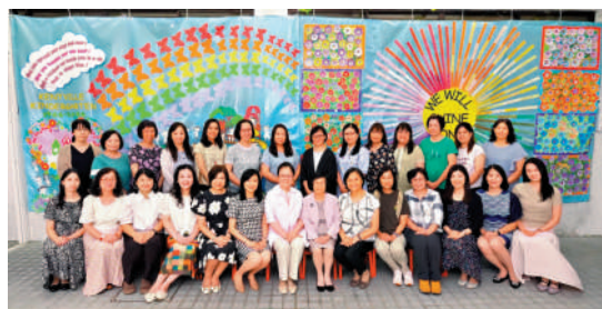
▲根德園於學校網站貼出的教學團隊相片。

根德園1966年創校，累計培育逾3萬名畢業生，升讀本港頂級小學成績亮眼。學校不參加幼稚園教育計劃，本學年學費4.6萬元，不收取債券與基建費，校舍分設九龍塘根德道及多實街兩處。根德園早於2023年已宣布停辦，此外，校內大部分教職員包括校監、校長、管理層及資深教師均已屆或接近退休年齡。