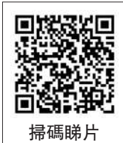
掃碼睇片