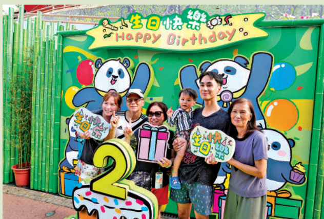
▲海洋公園已設置多個主題打卡位，甚受市民歡迎。