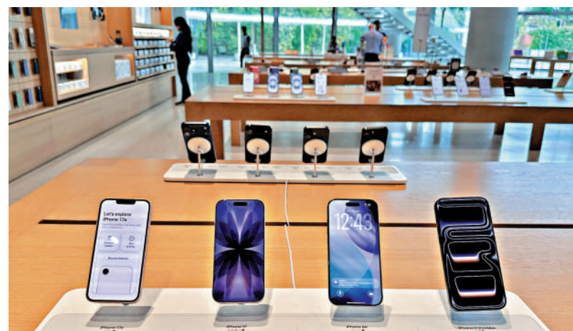
▲ 蘋果6月29日宣布提前發布安全性更新。

近期，美國科企 Anthropic 的新一代 AI 模型引發爭議。美國政府稱，相關模型可能被黑客利用，進行大規模網絡攻擊，因此對其實施限制。Anthropic 對此表示不滿，認為其模型的安全風險被誇大。