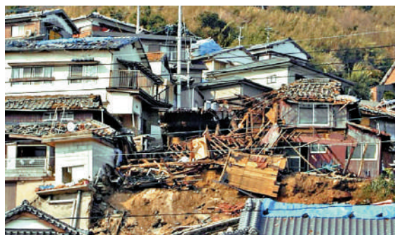
▲ 福岡縣2005年發生強震，當地建築嚴重受損。資料圖片

岩手縣近海的地震亦受到關注。近日兩次強震均發生在「三陸沖」海域，京都大學防災研究所的西村卓也教授警告說，這裏可能成為「最危險的區域」，未來可能發生7.5級至8級大地震和海嘯。日本氣象廳也呼籲民眾保持警惕。