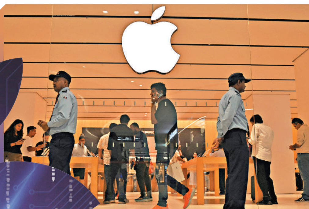
▲ 黑客攻擊影響蘋果在印度的布局。圖為印度班加羅爾的一家蘋果專賣店。