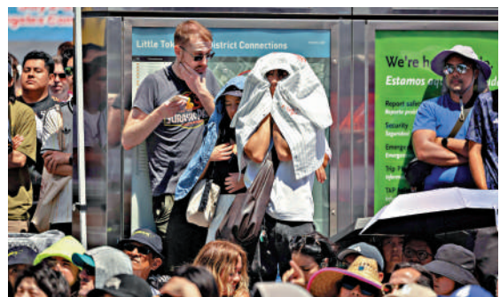
▲ 一名球迷6月14日在加州觀看世界盃時用襯衫遮陽。

歐洲近期亦飽受高溫之苦。不少美國遊客和網民批評法國「沒有冷氣機」，引起法國官員不滿。巴黎負責國際關係的副市長普爾瓦日前在社交媒體發文反擊稱，美國是主要溫室氣體排放國，對全球變暖及法國所遭受的極端高溫負有重要責任。