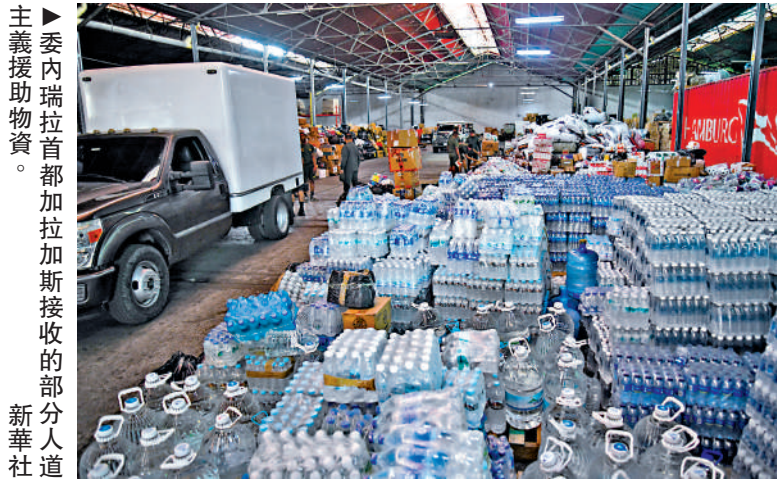
委內瑞拉代總統羅德里格斯6月30日表示，感謝中國政府在委內瑞拉地震後與該國人民站在一起。她此前已對中方表示感謝。最新消息指，中國紅十字會決定向委內瑞拉紅十字會提供30萬美元緊急人道主義現匯援助，用於支持其開展救災與災後重建工作。

【大公報訊】據新華社報道：委內瑞拉代總統羅德里格斯6月30日表示，感謝中國政府在委內瑞拉地震後與該國人民站在一起。她此前已對中方表示感謝。最新消息指，中國紅十字會決定向委內瑞拉紅十字會提供30萬美元緊急人道主義現匯援助，用於支持其開展救災與災後重建工作。