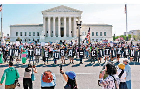
▲4月1日，支持出生公民權的示威者在最高法院大樓外集會。路透社

獨立機構，可能導致政府架構發生重大變革。 路透社指出，該項裁決實質上推翻了1935年「漢弗萊訴美國案」，當年最高法院一致裁定，時任總統羅斯福無權不受制約地更換由國會設立、旨在免受總統干預的獨立監管機構官員。 同日另一項裁決中，最高法院以5比4駁回聯邦政府請求，令美聯儲理事庫克得以留任。裁決書認定，若接受聯邦政府請求，將實質性消解法律對美聯儲「獨立性」的保護。