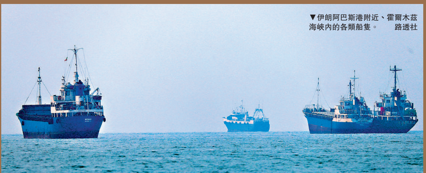
伊朗阿巴斯港附近、霍爾木茲海峽內的各類船隻。

博弈不斷 美伊暫時停火，外界關注霍爾木茲海峽航道水雷的清除進度。伊朗外交部6月29日回應法國總統馬克龍當天關於所謂「聯合掃雷」的言論稱，掃雷工作將完全由伊朗負責，而非其他國家。聯合國國際海事組織上周稱，霍爾木茲海峽航道內仍有約80枚水雷未清除。另外，針對美伊新一輪談判的時間，伊朗外交部發言人巴加埃6月30日表示，伊朗近期沒有與美國舉行任何級別會談的計劃。