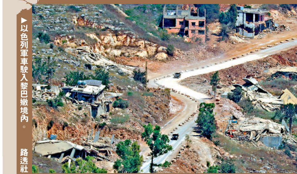
以色列軍車駛入黎巴嫩境內。