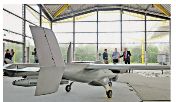
位於英格蘭西南部的軍用無人機生產基地。路透社

【大公報訊】綜合路透社、天空新聞網報道：英國首相斯塔默6月30日公布此一再被推遲的國防投資計劃（DIP）。根據該計劃，英國將增加150億英鎊國防開支，這樣未來4年英國軍費總額將接近3000億英鎊（約3.1萬億港元），創下歷史新高。其中，英國計劃投入50億英鎊（約520億港元）發展陸海空無人機和自主武器系統，以順應俄烏衝突後作戰趨勢的改變。 報道稱，這筆50億英鎊資金將用於英國武裝部隊史上規模最大的無人機投資，以打造一支高度整合的現代化部隊。海軍將轉型為「混合型海軍」，全面結合自主航行艦艇、人工智能、傳統軍艦和軍機作戰，海軍還將建造至少6艘通用戰鬥艦，以取代現役6艘45型傳統防空驅逐艦。陸軍將獲得5000萬英鎊撥款，採購無人機及研發無人車。空軍則聚焦研發自主作戰戰機，並於今年內正式部署電子戰無人機系統。 英國國防部指出，烏克蘭和伊朗戰事一再凸顯現代戰爭的節奏和特性：成本相對低廉的無人機可有效摧毀昂貴的打擊目標。烏克蘭目前每月消耗約20萬架無人機，而在伊朗戰事高峰期，戰