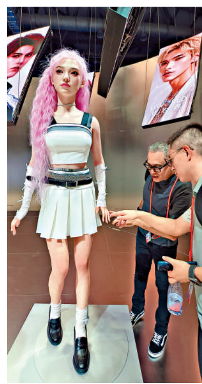
觀眾觸摸感受優必選全尺寸超仿生人形機器人的皮膚。