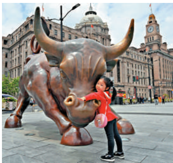
▲科技股和創業板仍然是資金集中炒作的地方。

對本人而言，最重要的底氣來自資金管理和風控——在現時倉位只有約40%的輕倉下，就有中長線持有的從容狀態了。價值投資從來不是比誰跑得快，而是比誰坐得穩。下半年，靜待花開結果時。(微博：有容載道)